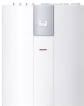
LWZ 5 S Plus

Kompaktgerät mit den Funktionen Lüften, Heizen, Warmwasserbereiten mit integrierte Kühlfunktion für Komfortgewinn in den Sommermonaten. Die LWZ 8 CS Premium lässt sich sowohl mit einer Solarthermie- als auch mit einer Photovoltaikanlage kombinieren.