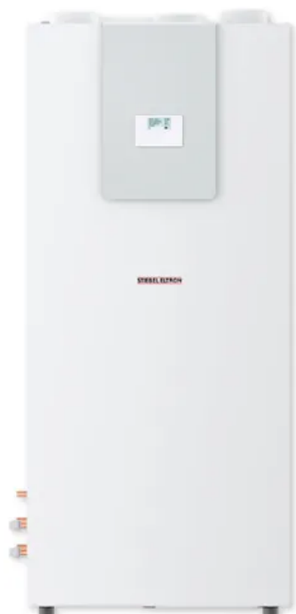
LWZ 8 S Trend

LWZ 5 S smart ist kompaktes Integral-System mit den Funktionen Warmwasserbereiten und Heizen für den Einsatz in neu gebauten Einfamilienhäusern.