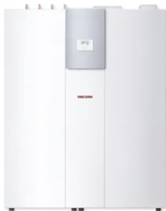
LWZ 5 S smart

Aus der Serie STIEBEL ELTRON Wärmepumpen von STIEBEL ELTRON