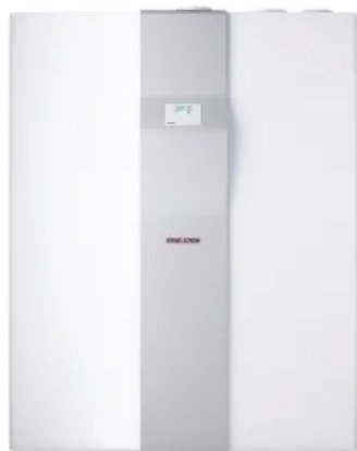
LWZ 8 CS Premium

Aus der Serie STIEBEL ELTRON Wärmepumpen von STIEBEL ELTRON