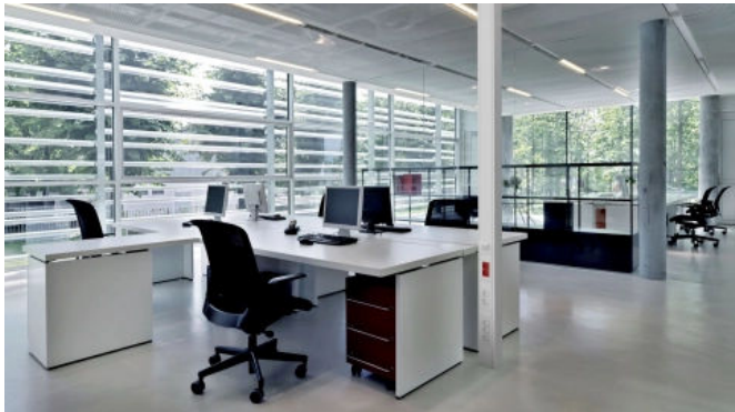
Boden-Decken-Installationssäulen sind frei im Raum positionierbar. Ein flexibler Schlauch zur Decke speist die Säule mit Daten- und Stromkabeln.

Die schwarzen Installationssäulen der OBO BlackLine sind besonders langlebig und nachhaltig: Im Falle einer Gebäudeumnutzung können die Produkte demontiert und für die nachfolgende Nutzung wiederverwendet werden.