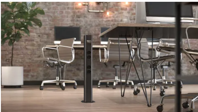
OBO Installationssäulen sind auch in der tiefschwarzen Ausführung OBO BlackLine erhältlich.

OBO Installationssäulen sind in den zwei Grundmaterialien Stahlblech oder Aluminium und den Designs rund, oval, quadratisch oder rechteckig erhältlich. Sie lassen sich von einer oder zwei gegenüberliegenden Seiten bestücken.