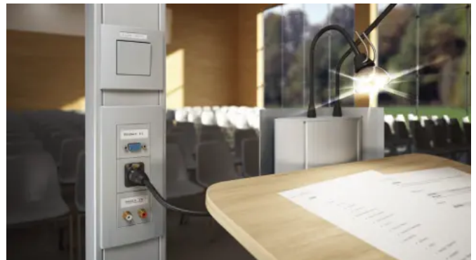
Mit dem Multimedia-Anschluss-System lassen sich Computer-, Video-, Audio-, Steuerungs- und Netzwerk-Anschlüsse gerade oder schräg einbauen.