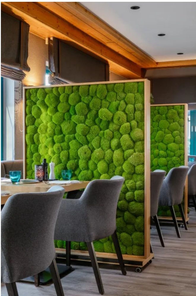
Trennwand mit Moos und Pflanzen - Innenbegrünung (© MOOSMOOS)

Wie alle Mooselemente von MOOSMOOS sind auch diese komplett pflegefrei und durch die leicht antistatische Wirkung staubabweisend.