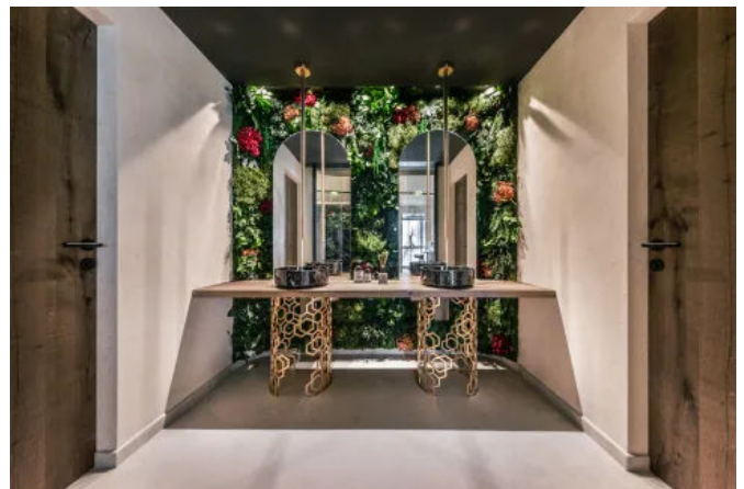
Blumenwand - Innenbegrünung