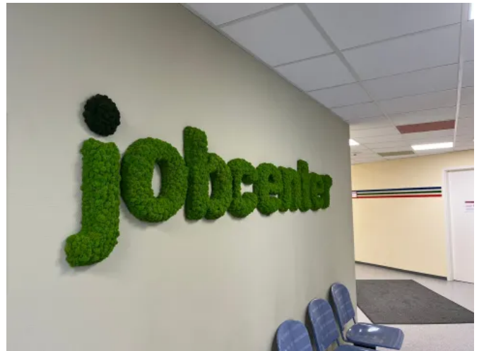
Grafiken aus Moos - Innenbegrünung