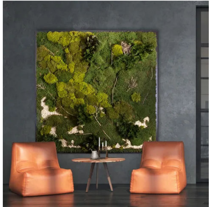
Moosbild aus Moos und Pflanzen - Innenbegrünung