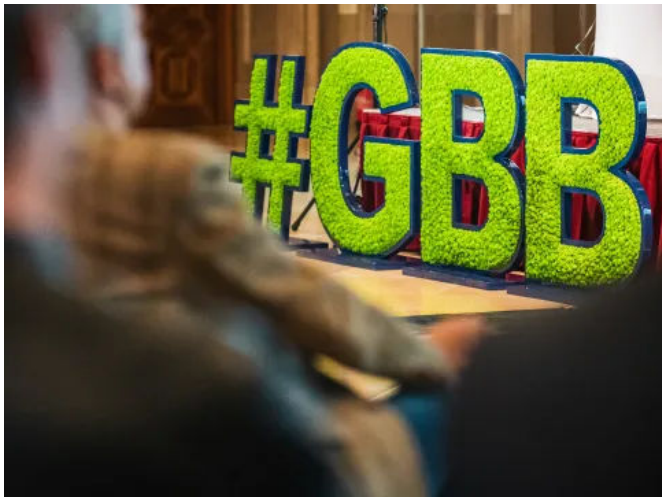
Grafiken aus Moos - Innenbegrünung (© Oskar Steimel)