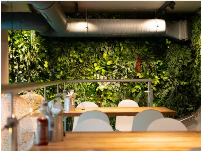
Dschungelwand Thai-Fresh Cuisine, München - Innenbegrünung

Aus der Serie Biophilic Interieur & Exterieur Design von MOOSMOOS