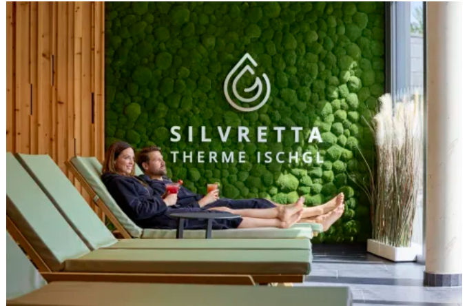
Grafiken aus Moos - Innenbegrünung (© Stefan Kürzi)