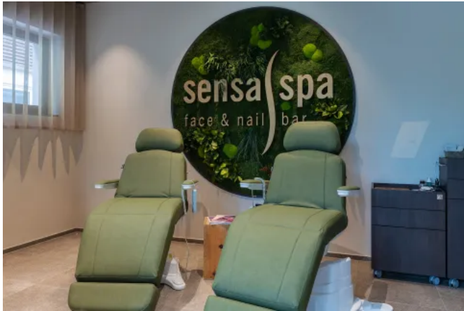
Grafiken aus Moos - Innenbegrünung

Aus der Serie Biophilic Interieur & Exterieur Design von MOOSMOOS