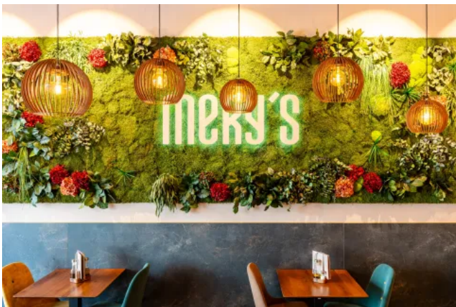
Blumenwand - Innenbegrünung

Die Mooswände mit floralen Elementen werden aus echten, langlebig konservierten Hortensien in Handarbeit gestaltet. Auf ein makelloses Endergebnis wird besonders geachtet. Der Unterschied zu frisch geschnittenen Hortensien ist kaum erkennbar, da die Form und Zellstruktur der konservierten Blumen vollständig erhalten bleibt, wodurch die gesamte Schönheit der Blüten auf natürliche Weise bewahrt wird. Diese Blumenwände mit ihren einzigartigen Akzenten strahlen nicht nur Ästhetik und Eleganz aus, sondern sind auch ein echter Hingucker. Eine Flowerwall aus echten Blumen passt in jede Lobby oder jedes Hotel und verleiht jedem Raum eine besondere Atmosphäre.