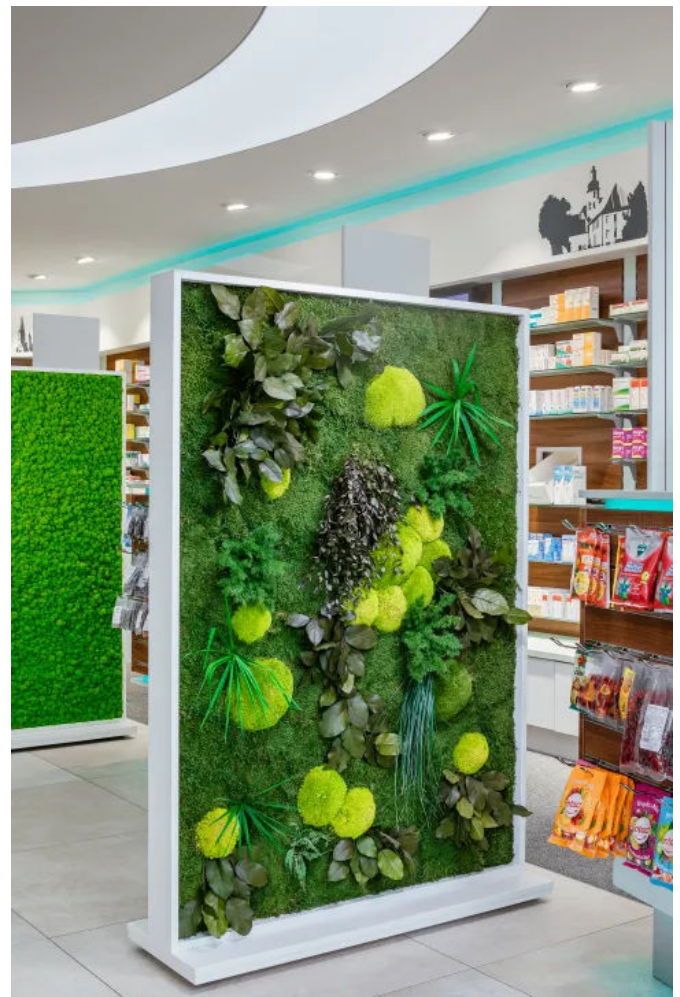
Trennwand mit Moos und Pflanzen - Innenbegrünung