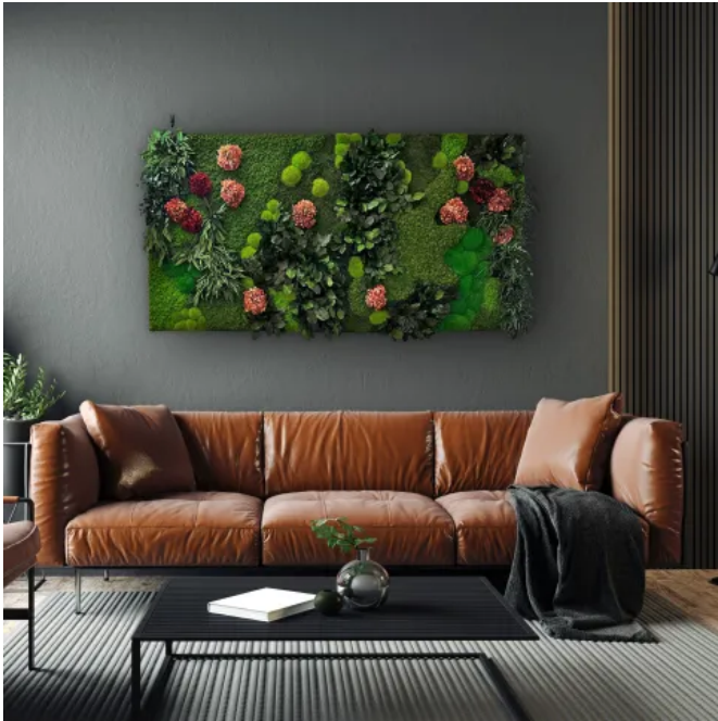
Moosbild aus Moos und Pflanzen - Innenbegrünung

Aus der Serie Biophilic Interieur & Exterieur Design von MOOSMOOS