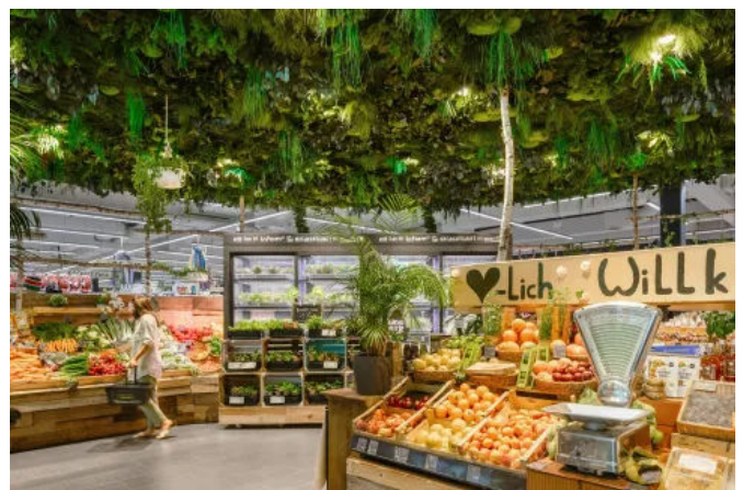
Decken aus Moos und Pflanzen - Innenbegrünung