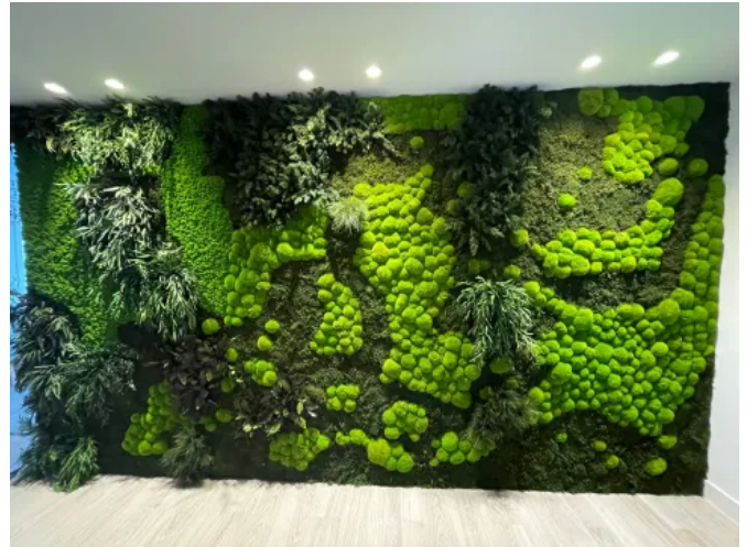
Privatkunde Madrid, Spanien - Innenbegrünung