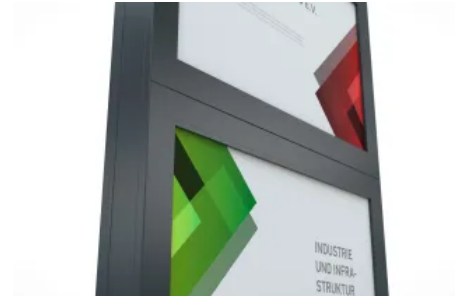
Ein- oder zweiseitig nutzbar

Die LED-beleuchteten, austauschbaren Werbeflächen ermöglichen Flexibilität und Präsenz bei Tag und Nacht, ideal für Firmen, Hotels, Einzelhandel und Krankenhäuser. Die nach unten hin offene Secure-Variante ermöglicht freie Sicht an Kreuzungen und Einfahrten.