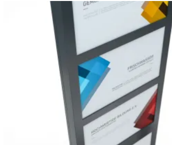
Text-Paneele austauschbar und nachbestellbar