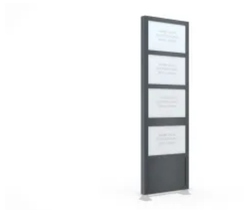
Werbepylon BigSign L