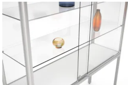
Stufenlos höhenverstellbare ESG-Fachböden

Aus der Serie Stadt- und Freiraumausstattung von WSM - Walter Solbach Metallbau