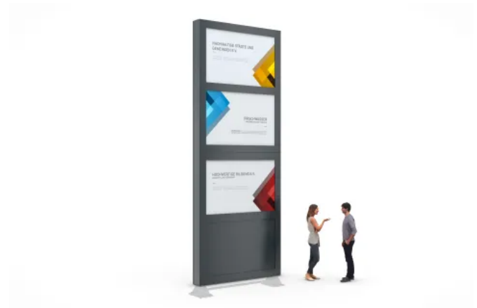
Der Werbepylon BigSign verfügt über ein modernes Design kombiniert mit einer robusten Stahlkonstruktion.