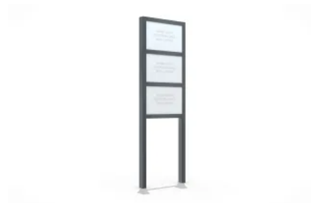
Werbepylon BigSign Secure L