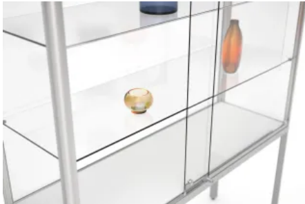
Stufenlos höhenverstellbare ESG-Fachböden

Aus der Serie Stadt- und Freiraumausstattung von WSM - Walter Solbach Metallbau