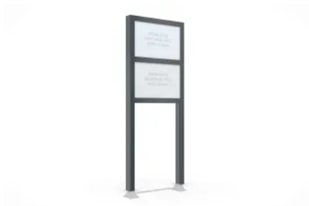
Werbepylon BigSign Secure S