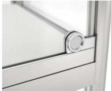
Erhältlich mit runden Eckverbindungen zur Sicherheit