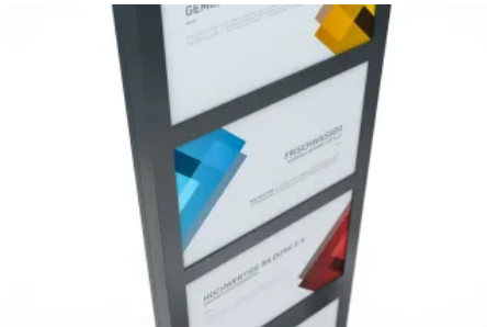
Text-Paneele austauschbar und nachbestellbar