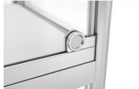
Erhältlich mit runden Eckverbindungen zur Sicherheit

Mit stufenlos höhenverstellbaren ESG-Fachböden und diebstahlgeschützten Ganzglastüren sind sie in verschiedenen Größen erhältlich, als Stand- oder Hängesystem, auch mit runden Eckverbindungen zur Unfallprävention.