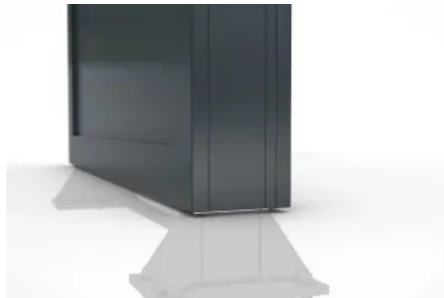
Hochwertiges, funktionales Design

Aus der Serie Stadt- und Freiraumausstattung von WSM - Walter Solbach Metallbau