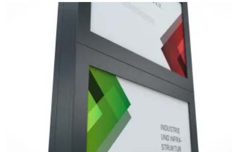
Ein- oder zweiseitig nutzbar

Die LED-beleuchteten, austauschbaren Werbeflächen ermöglichen Flexibilität und Präsenz bei Tag und Nacht, ideal für Firmen, Hotels, Einzelhandel und Krankenhäuser. Die nach unten hin offene Secure-Variante ermöglicht freie Sicht an Kreuzungen und Einfahrten.