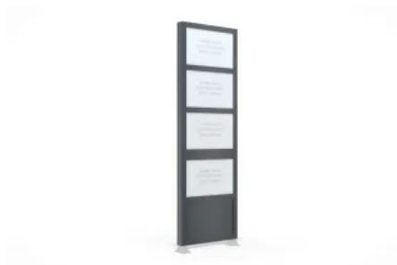
Werbepylon BigSign L