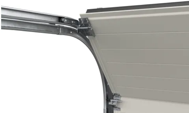
Optimierte Laufschienenradien für leiseren Torlauf