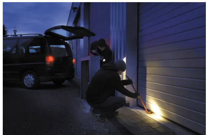
Sicherheit vor möglichen Einbruchversuchen mit der Aufschiebesicherung