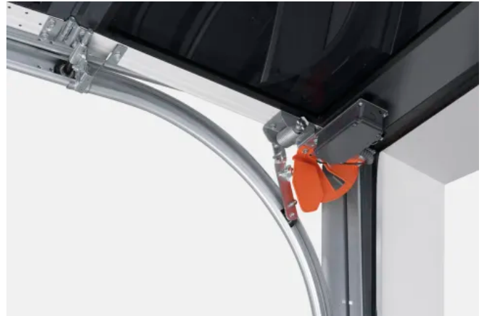
Niedrigsturzbeschlag für eine erhöhte Durchfahrt