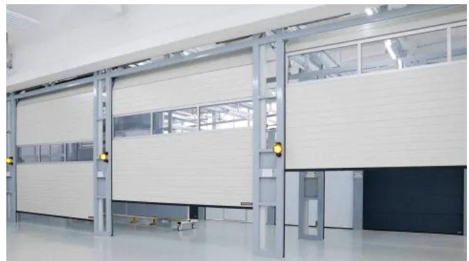
Öffnungsgeschwindigkeit der Baureihe 60 im Vergleich zu seinen Vorgängern | rechts: neue Baureihe 60 mit 1m/s | Mitte: alte Baureihe 60 mit 0,5 m/s | links: Baureihe 50 mit 0,45 m/s