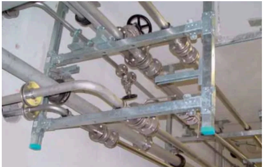
Anwendung Pharma, 41er- und 63-er Kombinationen in einer hängenden Rahmenkonstruktionen