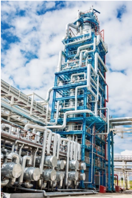
Chemiefabrik, Germany, © photollurg - fotolia.com