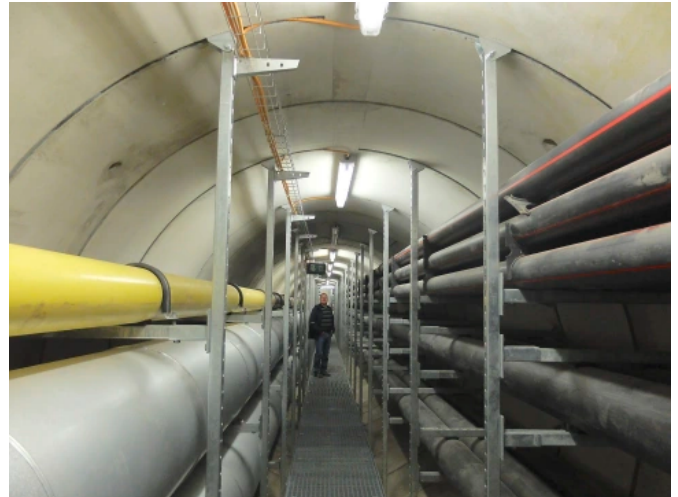
Kraftwerk Lausward, Düsseldorf © Planer Ingenieurbüro-Wendt