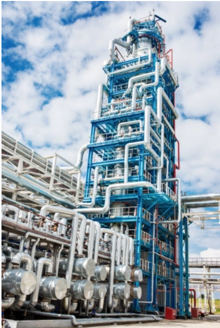
Chemiefabrik, Germany