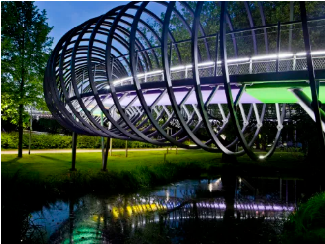
Rehberger Brücke, Oberhausen, Germany

Aus der Serie Industrietechnik von Leviat