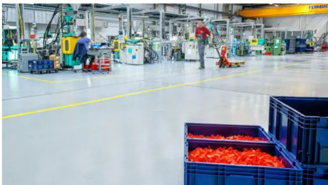
Verlaufbeschichtung ARTURO EP2500 in den Produktions- und Lagerhallen der Kissling Elektrotechnik GmbH

Objektbericht zur Referenz: Kissling Elektrotechnik