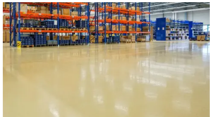
Verlaufbeschichtung ARTURO EP2500 in den Produktions- und Lagerhallen der Kissling Elektrotechnik GmbH