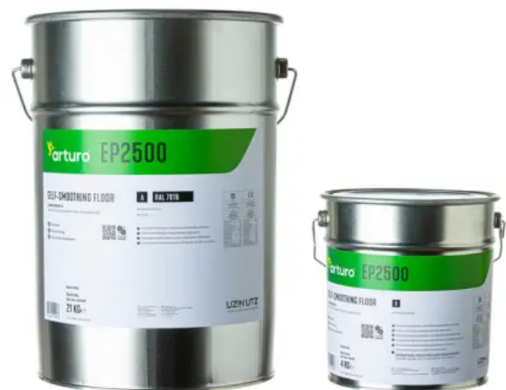
Arturo EP2500: Hochbelastbare Standard EP-Verlaufbeschichtung