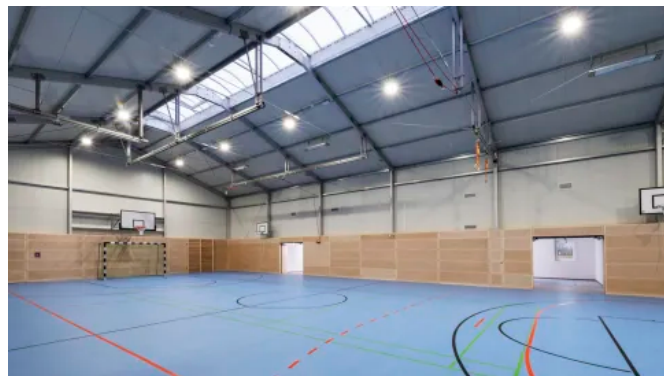
Sporthallen und Mehrzweckhallen - Modulare Raumlösungen

Losberger De Boer hat zahlreiche Sportanlagen realisiert, darunter Tennishallen, multifunktionale Einrichtungen, Trampolinhallen und Schwimmbäder. Je nach Verwendungszweck der temporären Einrichtung lässt sich die ideale Sporthalle für die jeweiligen Bedürfnisse schaffen. Die Raumlösungen können jahrzehntelang genutzt werden.