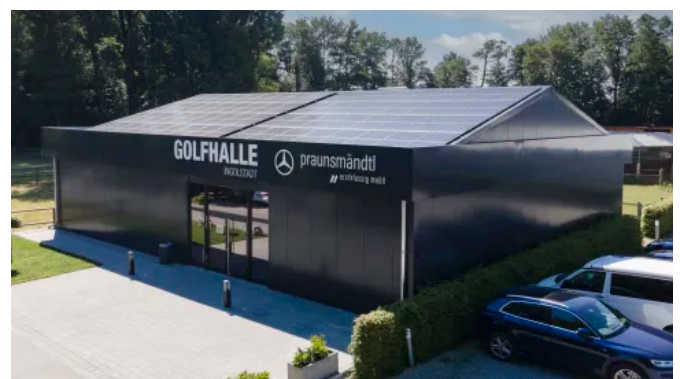
Modulare Raumlösungen für kurz- und langfristige gewerbliche Nutzung