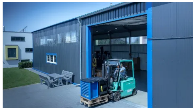
Lager- und Logistikhallen - Modulare Raumlösungen