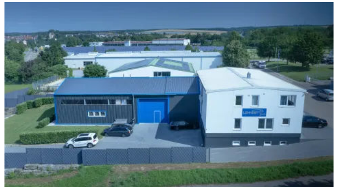
Lager- und Logistikhalle - Modulare Raumlösungen

Der Zugang zur Halle ist über ein großes Sektionaltor sowie Personentüren möglich, die zusammen mit Lichtbändern und Fensterelementen in die Seiten eingebaut wurden. Diese sorgen für eine kontrollierte Entlüftung und möglichst viel Tageslicht im Halleninnern. Um das Stückgut besser vor Tropf- und Schwitzwasser zu schützen, wurde die Wandbekleidung mit einem Antikondensat beschichtet, die zusätzlich zur Hallenisolierung beiträgt. Neben der technischen Ausstattung legte Lehnert Tools einen besonderen Wert auf die Gestaltung der Lagerhalle. Aus diesem Grund wurden die Trapezbleche und Kantenteile in den RAL-Farben des Unternehmens angefertigt.