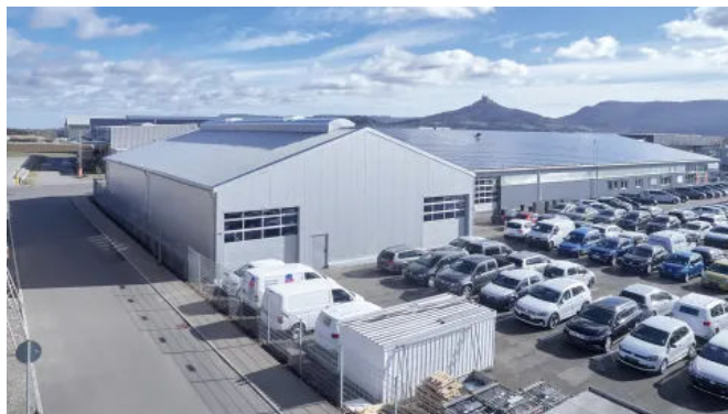
Produktionshallen und Werkstätten - Modulare Raumlösungen

Dies bietet ein One-Stop-Shop-Erlebnis, bei dem Elektrizität, Beleuchtung, Heizung, Klimatisierung, Belüftung, Isolierung, Sanitäranlagen, Büros und Lagerräume installiert werden, sodass keine zusätzlichen Vorkehrungen getroffen werden müssen.