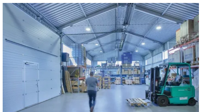
Lager- und Logistikhalle - Modulare Raumlösungen