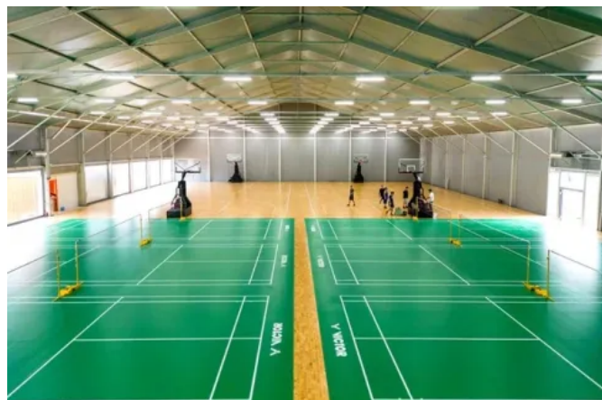
Sporthallen und Mehrzweckhallen - Modulare Raumlösungen