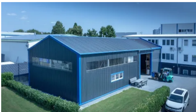
Lager- und Logistikhalle - Modulare Raumlösungen