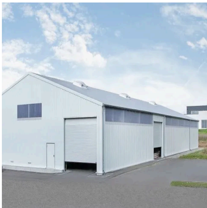
Produktionshallen und Werkstätten - Modulare Raumlösungen