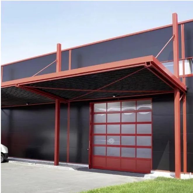
Teckentrup Industrie Sektionaltor SL 40