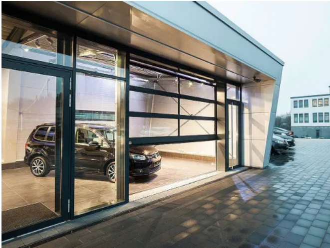
Teckentrup Industrie Sektionaltor SLX 40