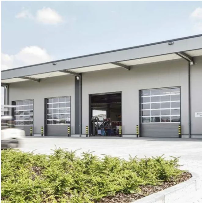
Teckentrup Industrie Sektionaltor SLW 40