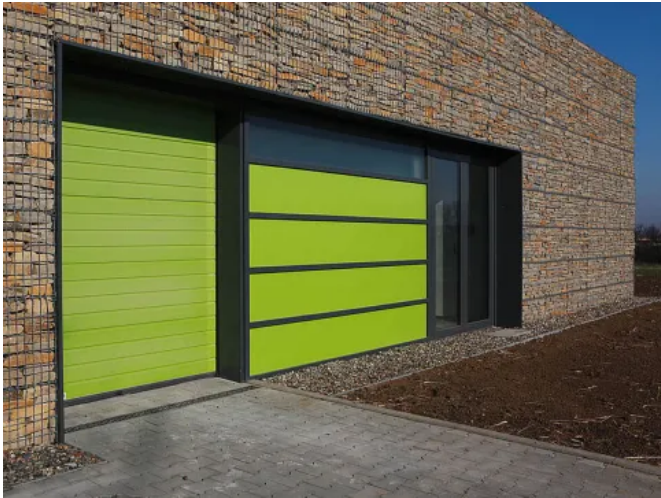
Teckentrup Industrie Sektionaltor SW 40