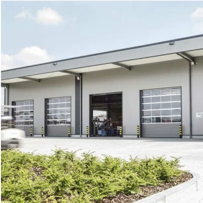
Teckentrup Industrie Sektionaltor SLW 40