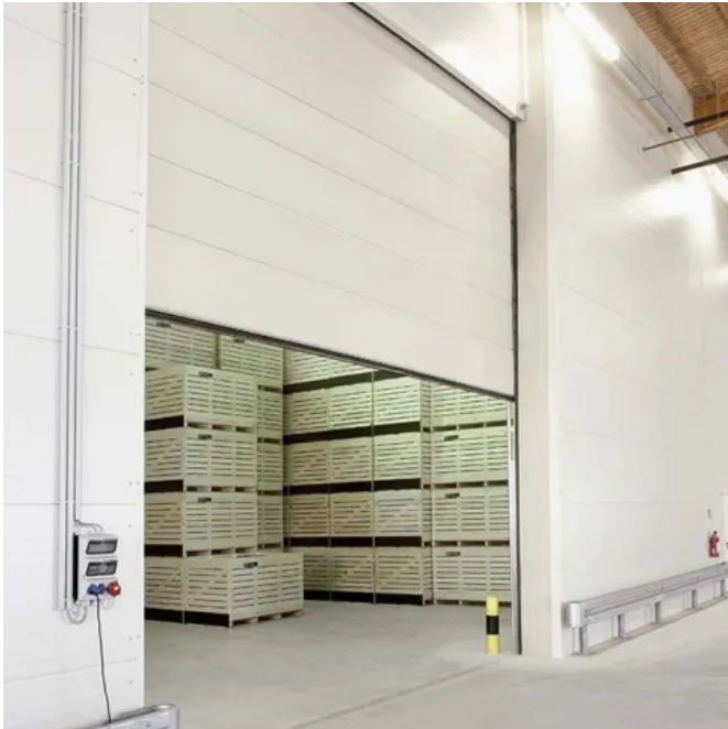
Teckentrup Industrie Sektionaltor SW 80