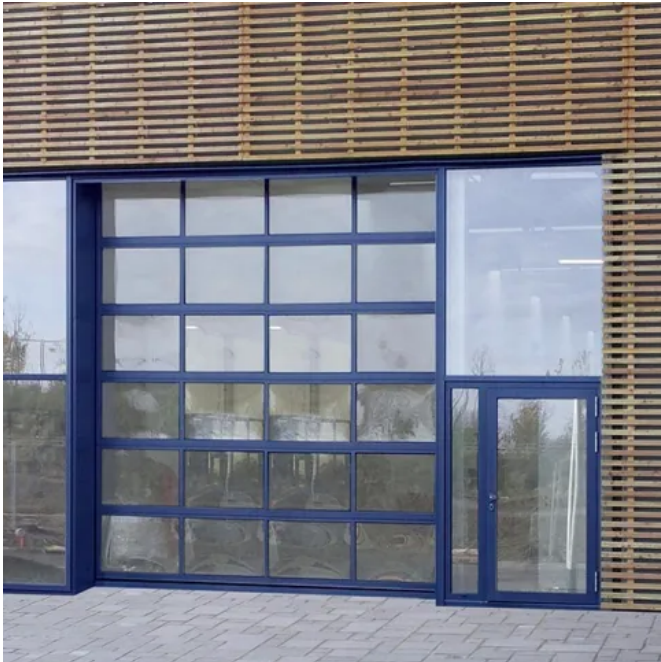
Teckentrup Industrie Sektionaltor SL 80