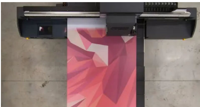
Das Wunschmotiv wird gedruckt