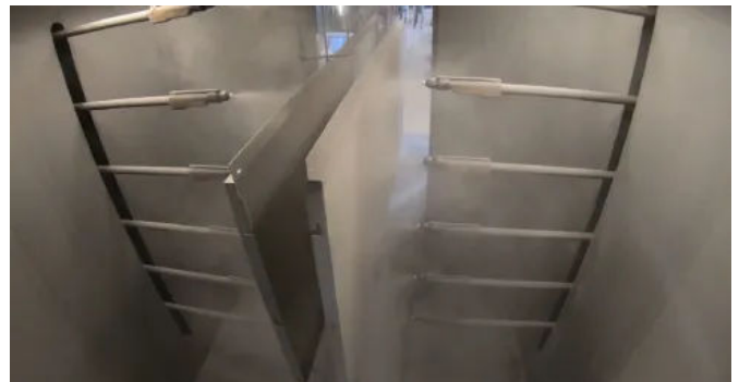
Pulverbeschichtung mit TIGER Drylac®

Von der ersten Idee bis zum fertigen Objekt: TIGER begleitet das Projekt von Anfang an. Ein kompetentes Team berät bei der Design- und Farbauswahl und unterstützt in der technischen Umsetzung.