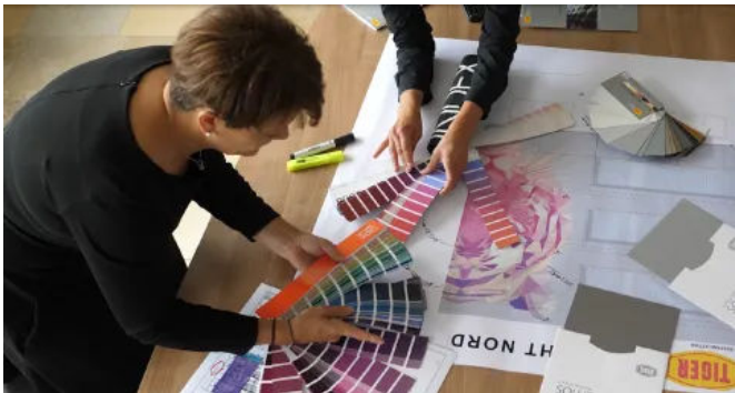
Motiv, Farbe und Struktur werden bis ins Detail festgelegt.