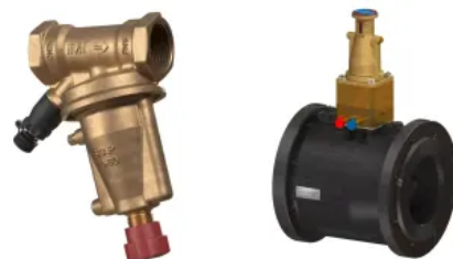
Stap und TA-Pilot-R

TA-PILOT-R ist ein sehr leistungsfähiger Differenzdruckregler, der den Differenzdruck einer Last konstant hält. Die Genauigkeit von TA-PILOT-R schafft stabile Bedingungen, um die Ventilautorität von stetigen Regelventilen sicherzustellen. Zusätzlich werden Geräusche verhindert und der Einregulierungsvorgang erleichtert. TA-PILOT-R ist ein Differenzdruckregler für den Einbau in die Rücklaufleitung. Messnippel ermöglichen die Druckmessung zu Diagnosezwecken.