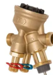
TA-Modulator: Druckunabhängiges Regel- und Regulierungsventil zur stetigen Regelung (PIBCV)

Druckunabhängiges Regel- und Einregulierungsventil TA-Nano für eine genaue Leistung über die gesamte Produktlebensdauer. Der einstellbare maximale Durchfluss ermöglicht individuelle Durchflussmengen, verhindert zu hohe Durchflüsse und erreicht so eine genaue hydronische Regelung. In Kombination mit Einregulierungscomputern sind vielfältige Messungen und Diagnosen möglich.