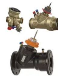
TA-MODULATOR: Druckunabhängiges Regel- und Regulierventil zur stetigen Regelung (PIBCV)

Druckunabhängiges Regel- und Regulierventil für eine präzise Temperaturregelung. Das Ventil kann sowohl mit stetigen als auch mit 3-Punkt Stellantrieben ausgerüstet werden. Der integrierte Differenzdruckregler garantiert eine hohe Regelautorität und Regelstabilität sowie eine automatische Begrenzung der Durchflussmenge. Die Messung des Durchflusses und des verfügbaren Druckes ermöglicht eine Systemoptimierung und Diagnose.