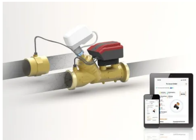
TA-Smart: Smartes Durchgangs-Regelventil für Heizungs- und Kühlungsanwendungen

Die EQM-Charakteristik des Durchgangsregelventils bietet die hochpräzise Durchfluss-, Temperatur-, Energie- und Leistungsmessung. TA-Smart kann entweder den Durchfluss oder die Leistung regeln, bietet hohe Flexibilität in der Anlage und liefert hohen Komfort bei bester Effizienz in Heizungs- und Kühlungsanwendungen. Seine kompakte Bauweise und die einfache Parametrierung reduzieren die Einbau- und Inbetriebnahmezeit.