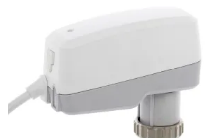
TA-Slider 500: Digital konfigurierbarer stetiger Push-Stellantrieb 500 N.