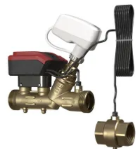
TA-Smart DN 15-50