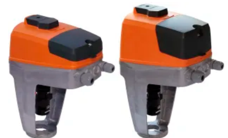
TA-Slider 750 & 1600: Digital konfigurierbare stetige Push/Pull-Stellantriebe – 750 N/1600 N.

Digital konfigurierbare Stellantriebe mit Möglichkeit zur Temperaturmessung für alle Regelungssysteme, mit oder ohne BUS-Kommunikation. Verwendung als Antrieb an Regelventilen zur Behebung kleiner Temperaturdifferenzen (tVL – tRL) oder für den Change-Over-Betrieb, basierend auf der Vorlauftemperatur tVL oder der Temperaturdifferenz \Delta T . Die zahlreichen Einstellmöglichkeiten erlauben eine flexible Anpassung der Parameter an die Gegebenheiten vor Ort. Der frei programmierbare Digitaleingang, Relais und der einstellbare maximale Ventilhub eröffnen neue Möglichkeiten für moderne hydronische Regelungen und den hydraulischen Abgleich.