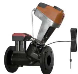
TA-Smart DN 65-125