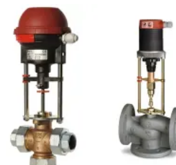
CV 216/316 RGA und CV 206/216/306/316 GG: Für den Einsatz in der Haustechnik bei Heizungs- und Kälteanlagen.

2 oder 3 Weg, DN 15-150, Grauguss Für den Einsatz in der Haustechnik bei Heizungs- und Kälteanlagen. Verfügbar bis zur Dimension DN 150, Druckklasse PN 6 und PN 16 mit Flanschen.