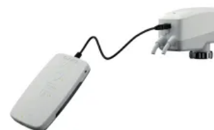
TA-Dongle: Digitale Konfiguration von TA-Slider ohne BUS-Kommunikation