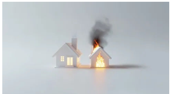
IGNIRIT® - biobasiertes Bindemittel mit flammhemmenden Eigenschaften