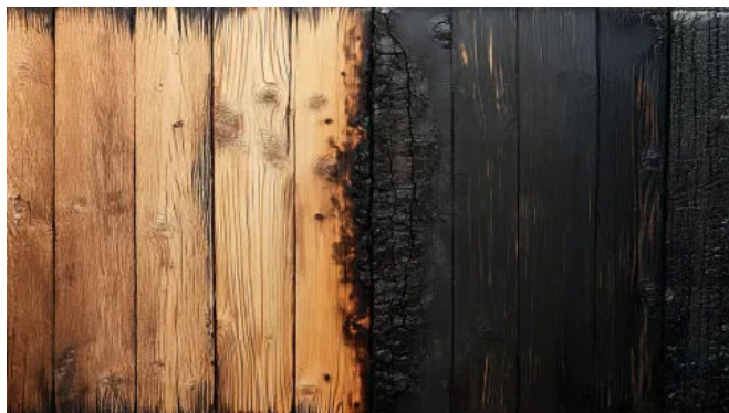
IGNIRIT® - biobasiertes Bindemittel mit flammhemmenden Eigenschaften

Hinweis zur Anwendung: Die Angaben stützen sich auf den Stand der Kenntnisse und Erfahrungen zum Zeitpunkt seiner Erstellung. Sie wurden mit größtmöglicher Sorgfalt erstellt, eine Haftung für Vollständigkeit und Richtigkeit kann jedoch nicht übernommen werden. Die Angaben bedeuten keine Garantie oder Eignung für einen bestimmten Einsatzzweck. Sie bedeuten keine Erweiterung von Rechten und Pflichten aus dem jeweiligen Lieferverhältnis und befreien den Verarbeiter des Produkts nicht von seiner Verpflichtung zur sorgfältigen Prüfung, insbesondere der Wareneingangskontrolle und der Eignung des bezogenen Produkts für seinen Anwendungszweck. Dies gilt insbesondere für alle verarbeitungsrelevanten Prozessschritte vor und nach der Verarbeitung des Produkts, die einen erheblichen Einfluss auf das Ergebnis des Verarbeitungsprozesses haben können, die aber vollständig außerhalb der Kontrolle von KURZ liegen. Der Inhalt dieses Dokuments ist nicht zur Beschreibung der Qualitätseigenschaften des jeweiligen Produkts bestimmt.