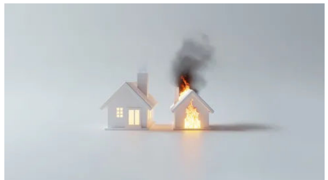
IGNIRIT® - biobasiertes Bindemittel mit flammhemmenden Eigenschaften