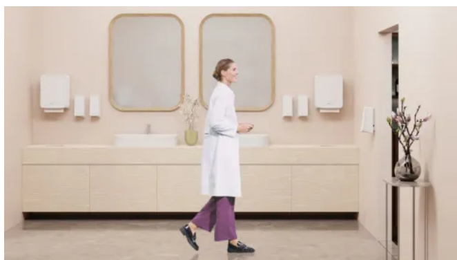
CWS PureLine in medizinischen Bereichen