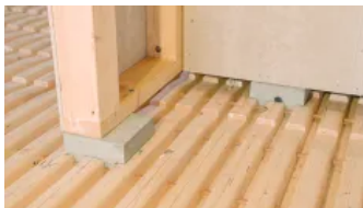
Druckfeste Unterleger für Zwischenwände I

Der Verguss mit der maxit HBV-Vergussmasse erfolgt erst, wenn das Gebäude wettergeschützt ist. Durch das Fließestrich-Verfahren lässt sich die Masse sehr effizient einbringen – mit hoher Flächenleistung und ohne relevante Beeinträchtigung des Bauablaufs. Kurze Ausschalzeiten von 3–10 Tagen und geringe Feuchte sorgen für einen schnellen Baufortschritt.