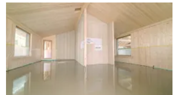
Planebene Druckzonen zur Aufnahme von Installationsebene bzw. Estrichaufbau I