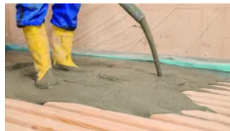
Einbringen der maxit HBV Vergussmasse I