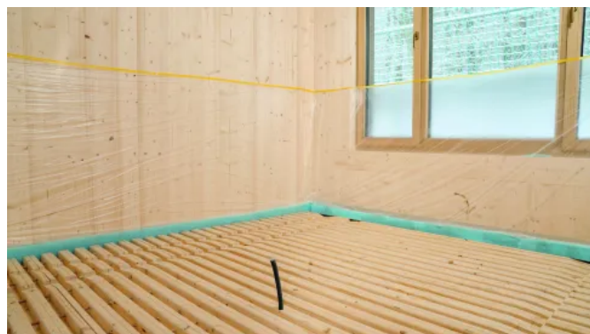
Deckenkonstruktion aus Massivholzfertigteilen I

Die DUOBLOCK Holz-Beton-Decke ist eine Verbundkonstruktion aus vorgefertigten Massivholz-Elementen und einer bauseitig aufgetragenen maxit HBV-Vergussmasse der Baustoffklasse A1. Sie eignet sich für den Einsatz als Geschossdecke sowie als aussteifende Dachscheibe in Gebäuden. Für die Elemente werden keilgezinkte Konstruktionsvollhölzer aus Fichte verwendet. Sie sind im Standard für den nicht sichtbaren Bereich egalisiert (NSi) und können auf Wunsch in Sichtqualität (Si) gehobelt geliefert werden.