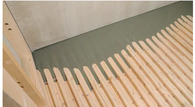
maxit HBV Vergussmasse I

Die maxit HBV-Vergussmasse ist ein Trockenbeton gemäß DIN EN 206 und DIN 1045-2. Sie ist speziell für das Vergießen der DUOBLOCK Holz-Beton-Verbunddecke entwickelt. Die Rezeptur ist auf Holzdecken abgestimmt und ermöglicht ein hohes Wasserrückhaltevermögen sowie eine Sieblinie, die den formschlüssigen Verbund der Bauteile unterstützt. Dadurch werden hohe Druckfestigkeiten, ein geringes Schwinden und verlässliche statische Eigenschaften erreicht.