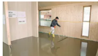
Schwabbeln sorgt für eine ebenmäßige Oberfläche I