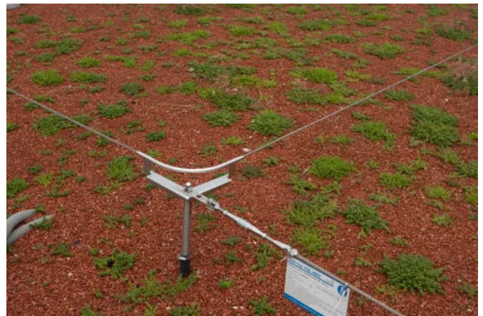
LUX-top® FSE 2003, überfahrbar