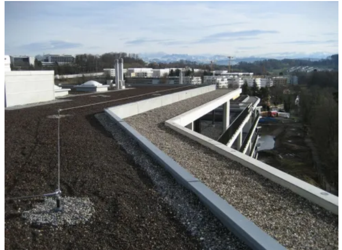
LUX-top® FSE 2003 in nicht überfahrbarer Ausführung