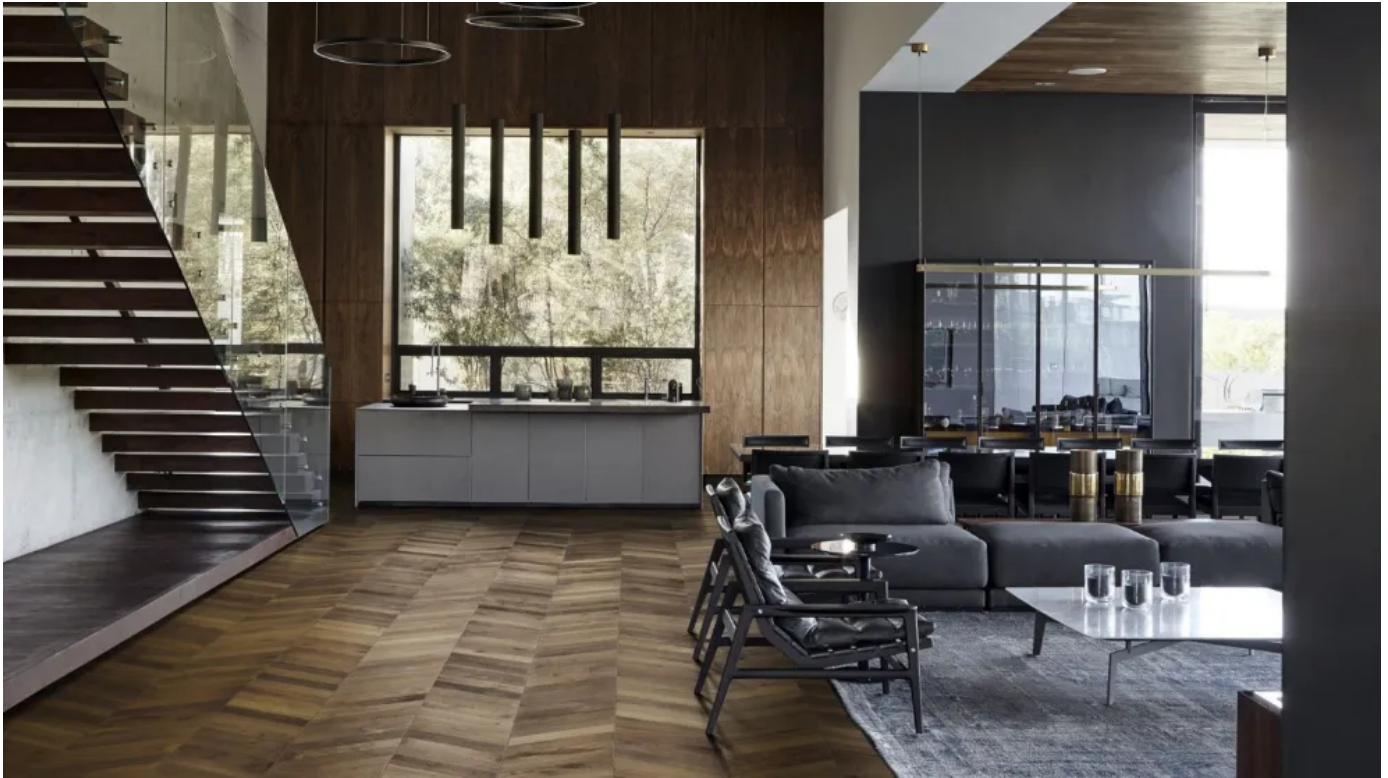
Kährs Chevron Dark Brown