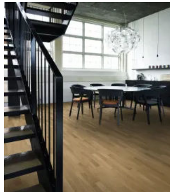
Kährs Eiche AB