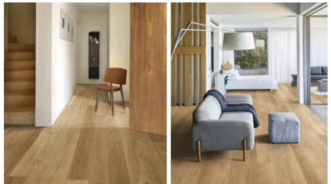
Kährs Eiche Dublin

Geeignet für die schwimmende Verlegung sowie zur vollflächigen Verklebung.