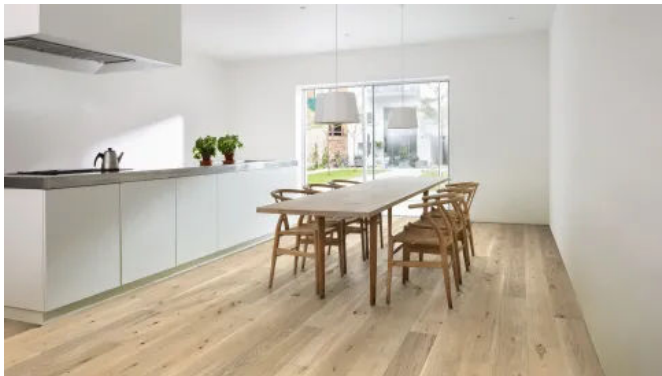
Kährs Eiche Piazza Sawmark White