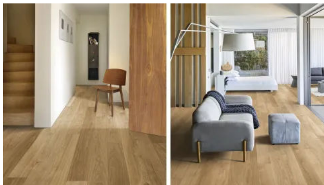
Kährs Eiche Dublin

Geeignet für die schwimmende Verlegung sowie zur vollflächigen Verklebung.