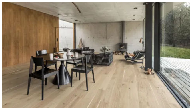
Kährs Eiche Eggshell