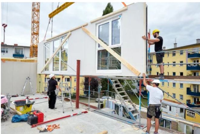
Holzbau mit Knauf