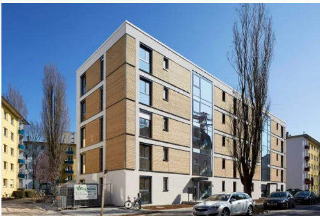
Der neue Standard im Holzbau: Knauf Diamant SX - die leistungsfähige Gipsplatte speziell für den Holzbau

Bei der Entwicklung der Diamant SX hat Knauf das Beste aller gängigen Platten für den Holzbau in einer neuen Platte vereint. Das Ergebnis: die leistungsfähige Gipsplatte speziell für den Holzbau.