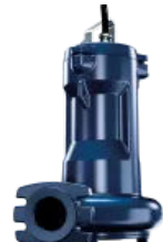
Sanipump VX 65/80