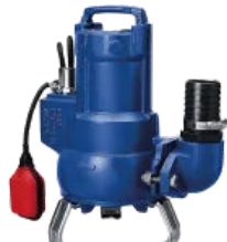
Sanipump VX 50