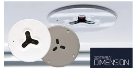
Soteria® Dimension deckenbündiger Rauchmelder

Weitere Informationen zur Soteria® Melderserie