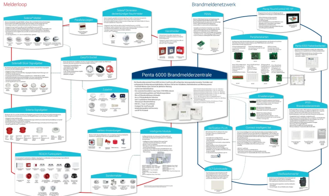
Systemübersicht - BrandmelderNetzwerk Penta 6000