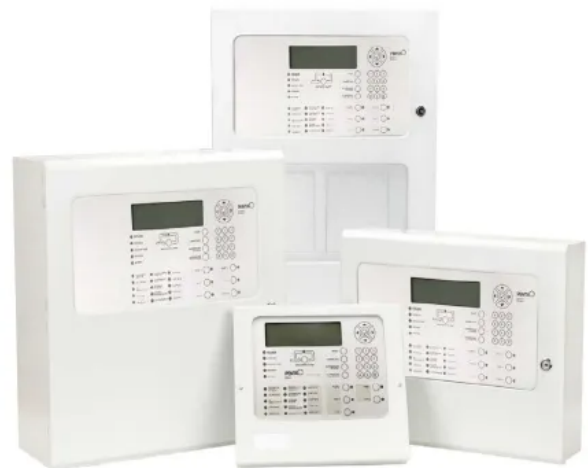
Brandmelderzentralen Penta 6000