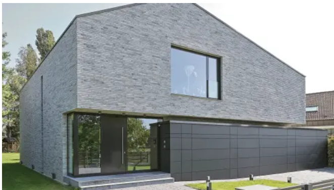
Einfamilienhaus mit heroal D 92 UD Haustürsystem