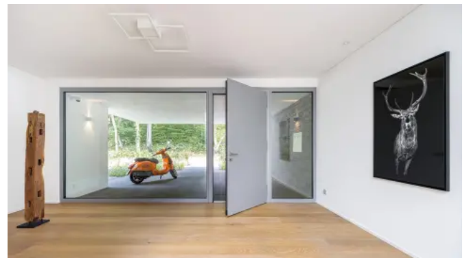
Einfamilienhaus mit heroal D 72 Haustürsystem Innenansicht in Wuppertal