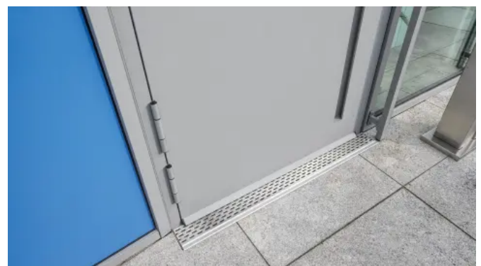
heroal DS Drainagesystem