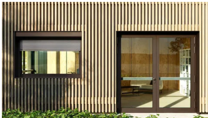
Türsystem heroal D 72 RC 3 mit Panikfunktion