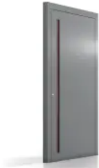
heroal Les Couleurs® Le Corbusier Haustür

Aus der Serie heroal Fenster-, Tür- und (Hebe-)Schiebesysteme von heroal