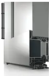
heroal D 72 Haustür

Weitere Informationen zur heroal Les Couleurs® Le Corbusier Haustür