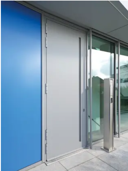
heroal Les Couleurs® Le Corbusier Haustür mit Drainagesystem heroal DS

Aus der Serie heroal Fenster-, Tür- und (Hebe-)Schiebesysteme von heroal