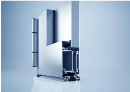
heroal D 65 Objektür

Aus der Serie heroal Fenster-, Tür- und (Hebe-)Schiebesysteme von heroal