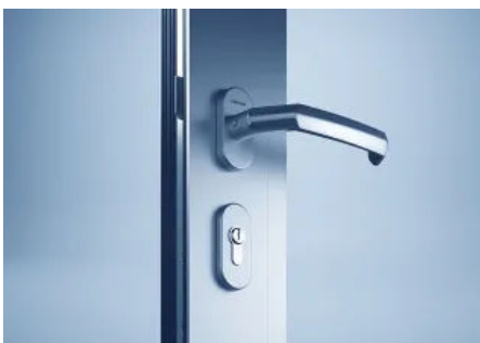
heroal DF Türbeschlag

Weitere Informationen zum heroal DS Drainagesystem