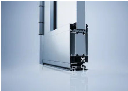
heroal D 72 Objektürsystem

Die Kombination mit Drainagesystemen für eine zuverlässige Oberflächenentwässerung bei Durchgangsbereichen mit Nullschwelle sowie das hochwertige Sortiment an Beschlägen runden das Angebot ab.