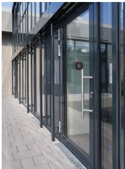
heroal D 72 Objektürsystem im GIP GRUNDIG Immobilienpark in Nürnberg