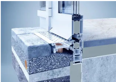
heroal DS Drainagesystem