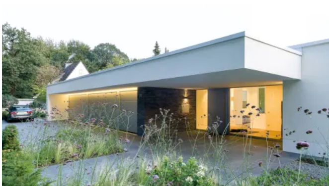
Einfamilienhaus mit heroal D 72 Haustürsystem in Wuppertal