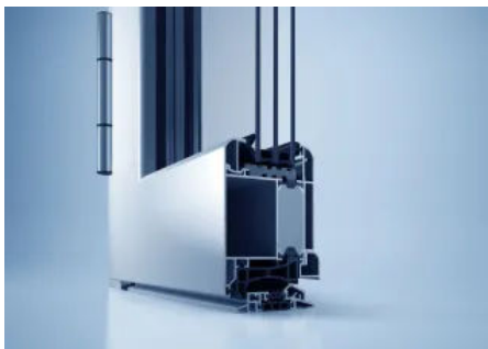
heroal D 72 RL Haustür

Weitere Informationen zum heroal D 72 Haustürsystem