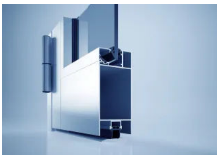
heroal D 65 C SP Rauchschutz-Türsystem

Weitere Informationen zum heroal FireXtech D 93 FP Brandschutztürsystem