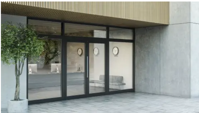
heroal FireXtech D 93 FP Brandschutzschutztür im Außenbereich