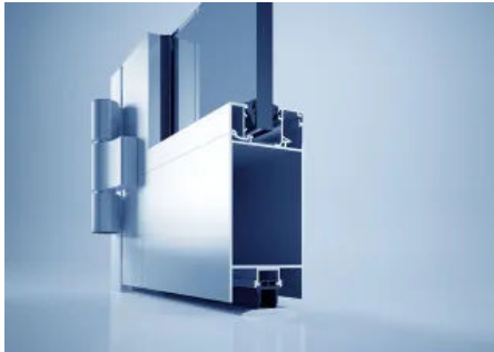
heroal FireXtech D 93 FP Brandschutz-Türsystem

Aus der Serie heroal Fenster-, Tür- und (Hebe-)Schiebesysteme von heroal