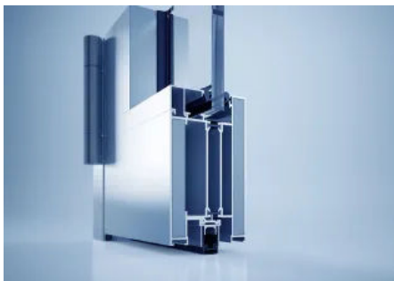
heroal D 82 FP Brandschutz-Türsystem