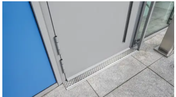
heroal DS Drainagesystem