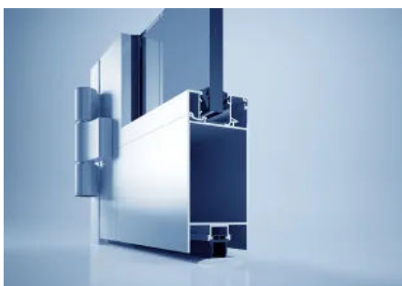
heroal FireXtech D 93 FP Brandschutz-Türsystem

Das unisolierte Türsystem heroal D 65 C SP kombiniert Planungs- und Fertigungssicherheit mit funktionaler und gestalterischer Vielfalt für Rauchschutztüren im Innenbereich. Basis des Türsystems für Rauchschutzanforderungen sind die Profile des Türsystems heroal D 65 C, die mit nur wenigen Zusatzkomponenten zu Rauchschutztüren erweitert werden können. Das nach DIN 18095 RS 1/RS 2 und EN 1634-3 geprüfte Rauchschutz-Türsystem heroal D 65 C SP bietet zahlreiche Ausführungsoptionen und deckt ein breites Gestaltungsspektrum ab.