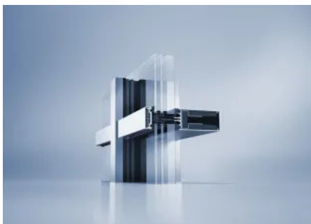
Brandschutzfassadensystem heroal C 50 FP