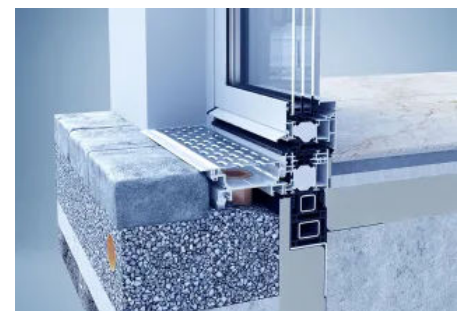
heroal DS Drainagesystem

Weitere Informationen zum heroal DS Drainagesystem