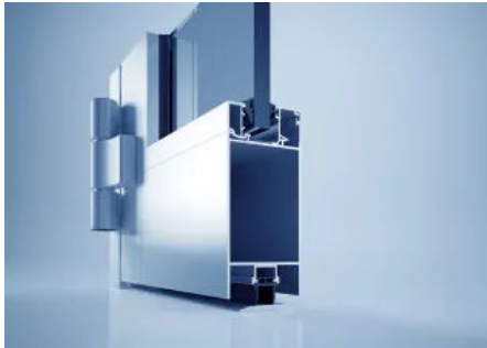
heroal FireXtech D 93 FP Brandschutz-Türsystem

Aus der Serie heroal Fenster-, Tür- und (Hebe-)Schiebesysteme von heroal