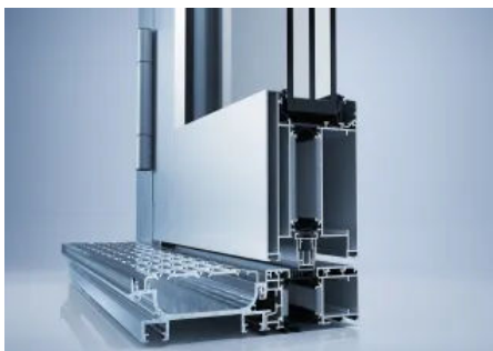
heroal FireXtech D 93 FP Brandschutztürsystem

Weitere Informationen zum heroal D 82 FP Brandschutztürsystem