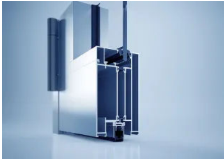
heroal D 82 SP Rauchschutztürsystem

Aus der Serie heroal Fenster-, Tür- und (Hebe-)Schiebesysteme von heroal