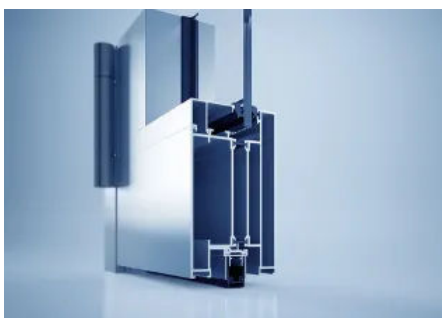
heroal D 82 SP Rauchschutztürsystem

Die Brandschutztürsysteme heroal D 82 FP (Fire Protection – Brandschutz) und heroal D 82 SP (Smoke Protection – Rauchschutz) bestehen durch ihre guten statischen Eigenschaften und sind besonders für stark frequentierte Bereiche geeignet.