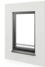
Absturzsicherung - Stange max. Breite 2400 mm