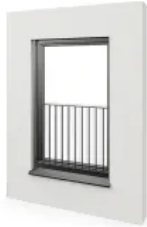
Absturzsicherung - Gitter max. Breite 2500 mm