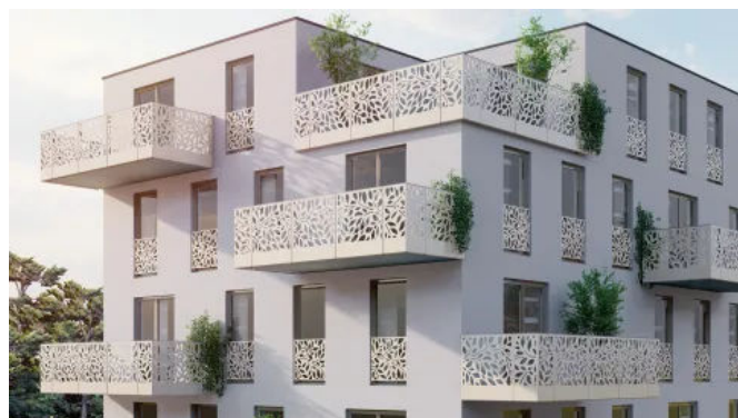
Innovative Absturzsicherungen für sichere und ästhetische Fassadengestaltung

Die Absturzsicherungen sind kompatibel mit den HELLA Aufsatzelementen TOP FOAM und TOP MINI plus und lassen sich nahtlos in diese Systemlösungen integrieren.