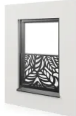
Absturzsicherung - Platte max. Breite 2500 mm