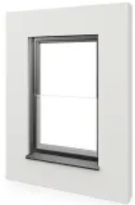
Absturzsicherung - Glas max. Breite 3000 mm

Aus der Serie HELLA Absturzsicherungen von HELLA Sonnenschutztechnik