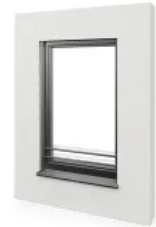
Absturzsicherung - Stange max. Breite 2400 mm