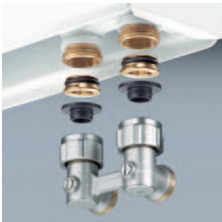
„Multiflex“ Verschraubungen für Heizkörper

Die „Multiflex“ Verschraubungen verbinden Heizkörper mit integrierten Ventilgarnituren normgerecht und sicher mit Rohrleitungen aus Kunststoff, Kupfer, Weichstahl oder mit Mehrschicht-Verbundrohren Produktübersicht