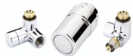
Set in Chrom, Ventilgehäuse für Rechtsmontage

Weiß RAL 9016, Chrom, Edelstahl gebürstet