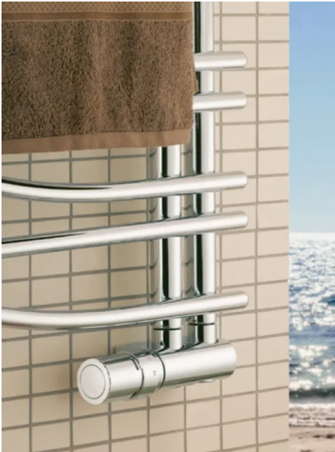
Die Ventilsets, hier VHX DUO in Chromausführung, ermöglichen eine technisch und optisch saubere Gesamtlösung. Ganz ohne "Montagespuren".