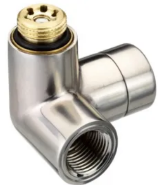
Design-Verschraubung RLV-X Edelstahl gebürstet

Weiß RAL 9016, Chrom, Edelstahl gebürstet