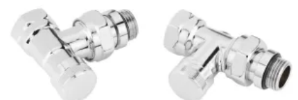
Rücklaufverschraubung RLV-CX: Eck / Durchgang

Die Rücklaufverschraubung RLV-CX ist mit selbstdichtendem Anschlussgewinde ausgestattet und in DN 15 in verchromter Ausführung in Eck und Durchgang lieferbar.