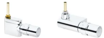
VHX-Armaturen-Set Mono, Chrom