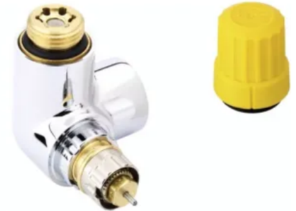
Design-Ventilgehäuse RA-URX Chrom

Weiß RAL 9016, Chrom, Edelstahl gebürstet