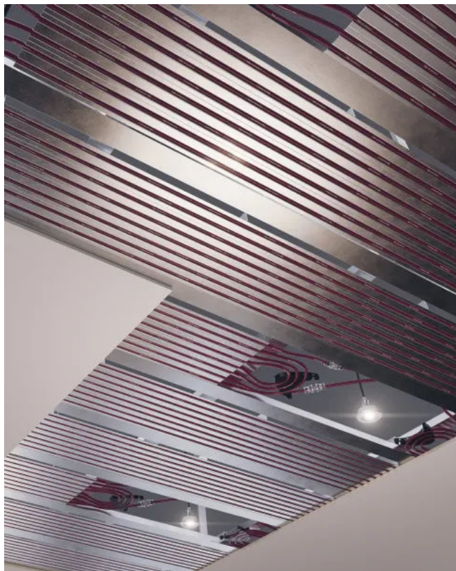
Aufgrund der großen Kontaktflächen zwischen Rohr, Lamelle und Gipskartonplatte werden hohe Leistungswerte ermöglicht.