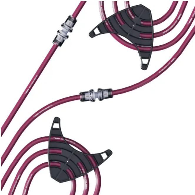
Mit dem Steckverbinder RAUTHERM NEO Easy Push 10 werden die Module ohne zusätzliches Werkzeug untereinander verbunden.

Aus der Serie REHAU Systeme zum Heizen, Kühlen und Lüften von REHAU Water Technologies