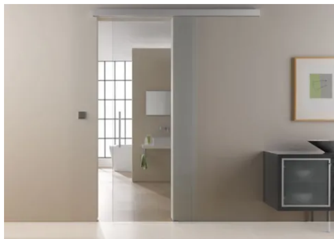
Anwendungsbeispiel HEILER Schiebewand Linie 1060, hier als Schiebetür zwischen Wohnbereich und Bad.

Der Einsatz erfolgt sowohl im Privat- als auch im Objektbereich. Die Linie 1060 ist für Decken- oder Wandmontagen geeignet und wird individuell an die bauliche Situation angepasst. Der filigrane Beschlag in zeitlosem Design besteht aus hochwertigem Aluminium, Silber matt, und passt sich perfekt der Umgebung an.