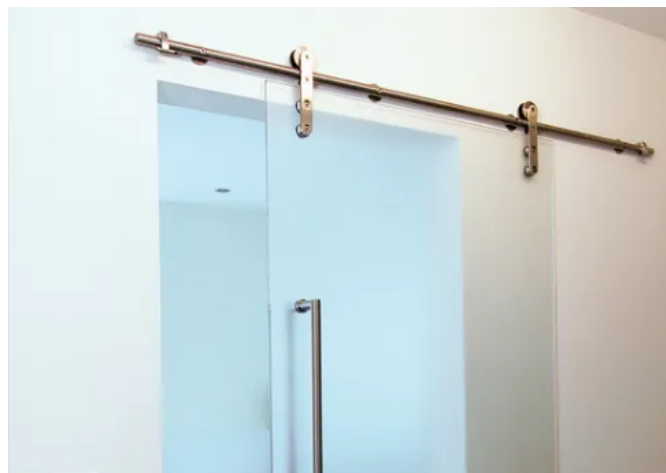
Der Schiebeschlag der Linie 5000 wird direkt auf der Wand montiert.

Glas-Schiebewände der Linie 5000 bestehen sowohl optisch als auch durch Funktion und Flexibilität.