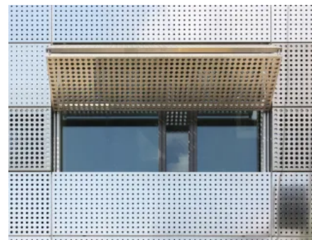
Ähnlich einem Vordach bietet der geöffnete Hebefaltladen Sonnenschutz