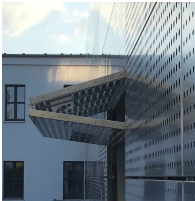
Hebefaltladen am Forschungsinstitut Iris