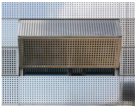
Die Fassade lässt sich auf Knopfdruck öffnen, der Sonnenschutz „faltet“ sich nach oben