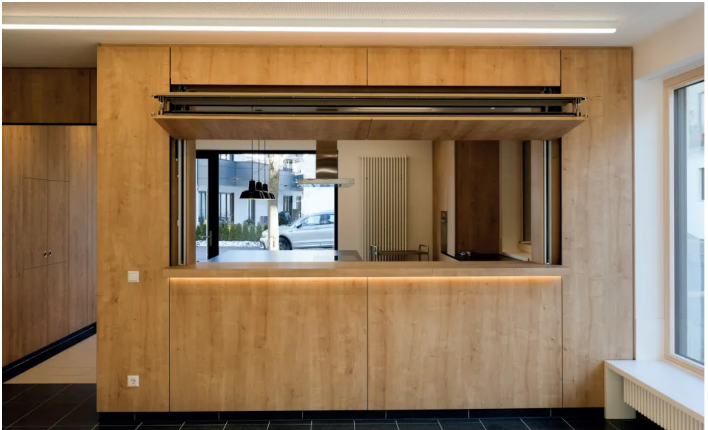
Hebefaltladen als moderner Thekenabschluss