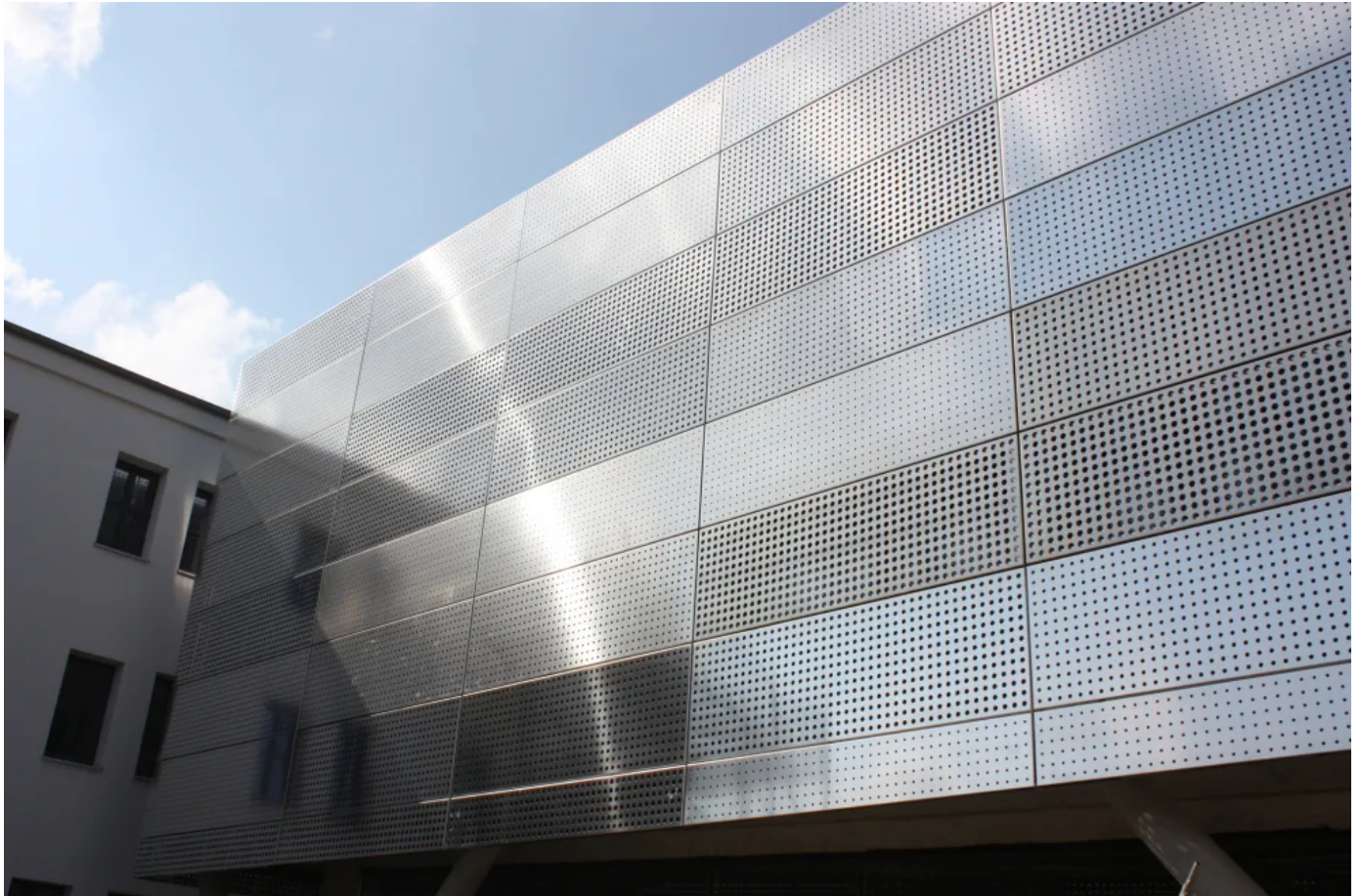
Hebefaltladen am Forschungsinstitut Iris

Aus der Serie Architektonischer Sonnenschutz von Baier