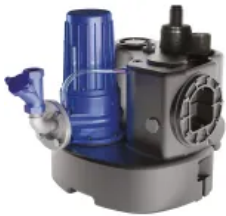
Sanicubic 1 GR