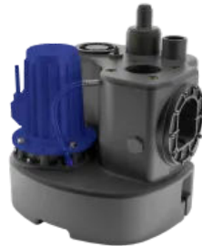
Sanicubic 1 FRK