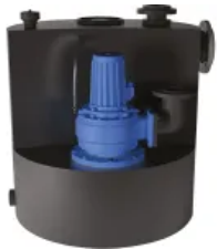
Sanicubic 1 SC

Aus der Serie Sanibroy: Hochleistungshebeanlagen, -tauchpumpen, Pumpstationen, Fettsabscheider von SFA Deutschland