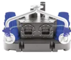
Sanicubic 2 GR