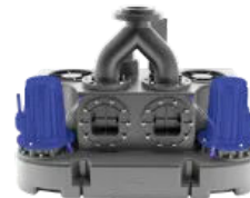
Sanicubic 2 FRK