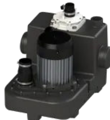
Sanicubic 1 GR HP