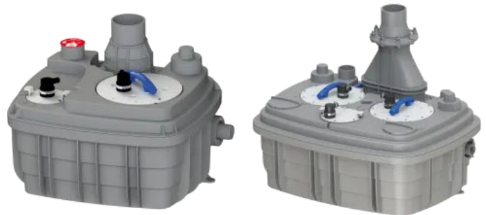
Sanicubic 1 VX