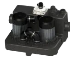
Sanicubic 2 GR HP