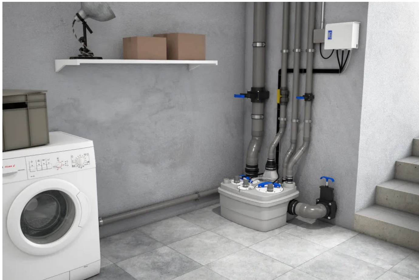
Sanicubic Hebeanlagen für Grau- und Schwarzwasser

Die Produktreihe Sanicubic beinhaltet ein breites Portfolio an Hochleistungshebeanlagen für Grau- und Schwarzwasser.