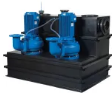
Sanicubic 2 SC