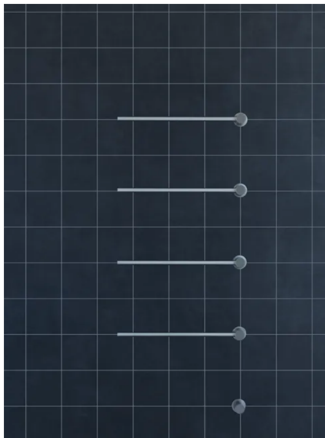
T39EL / 4