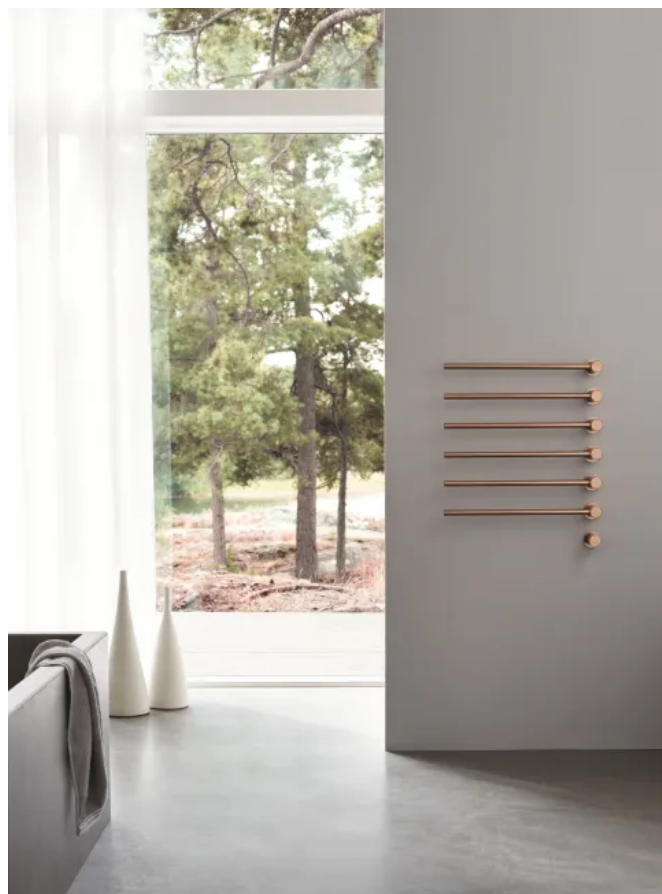
T39EL / 6