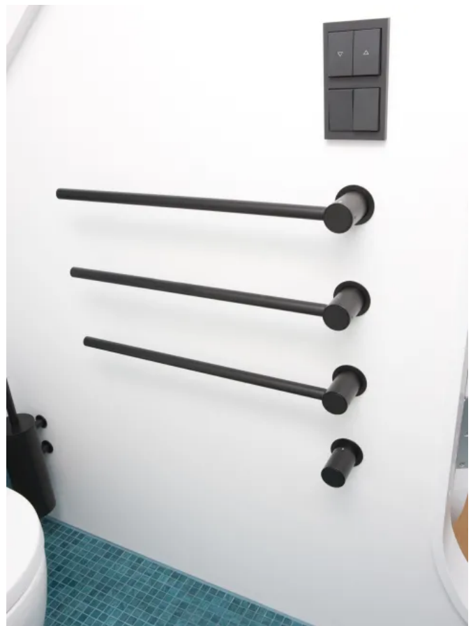
T39EL / 3