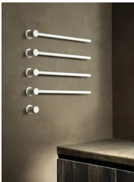
T39EL / 4