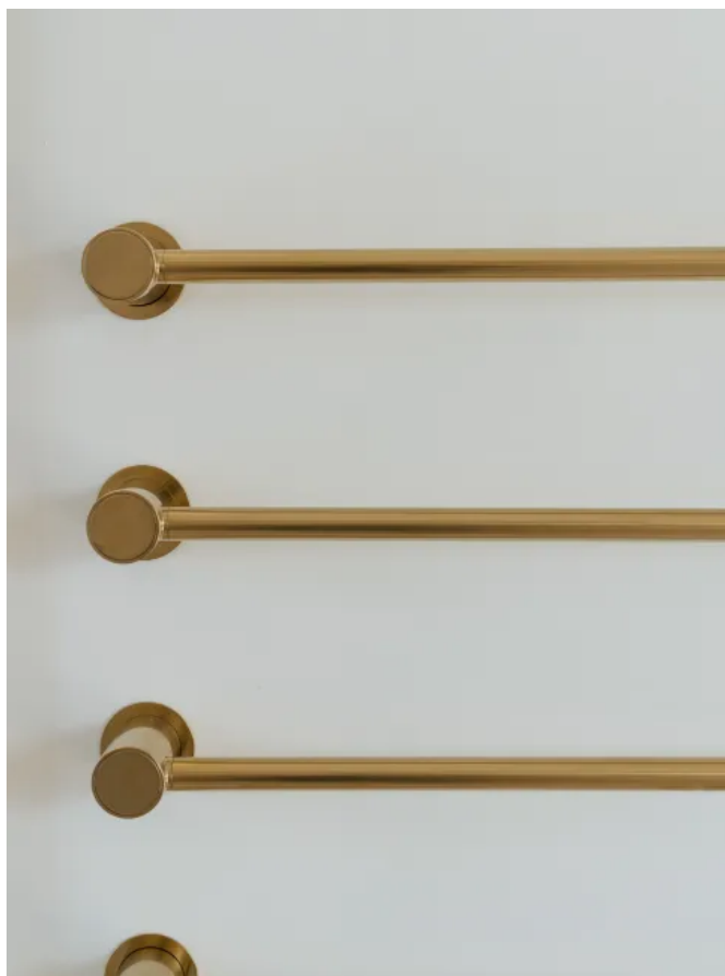
T39EL / 3

Aus der Serie Sanitärarmaturen und Accessoires von VOLA