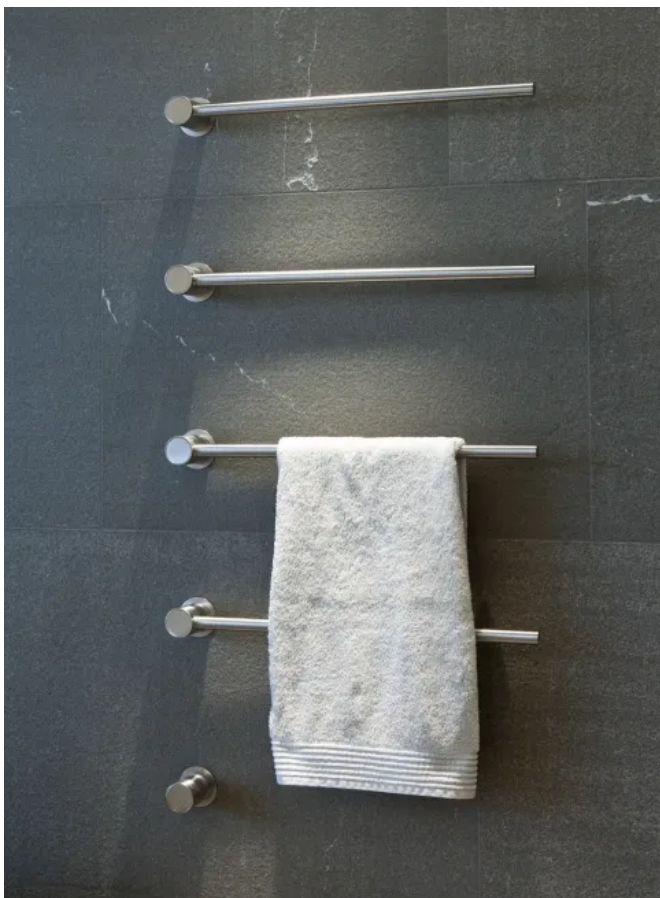
T39EL / 4

Bei Bestellung bitte das Bestellformular VOLA Handtuchwärmer verwenden: Bestellformular T39