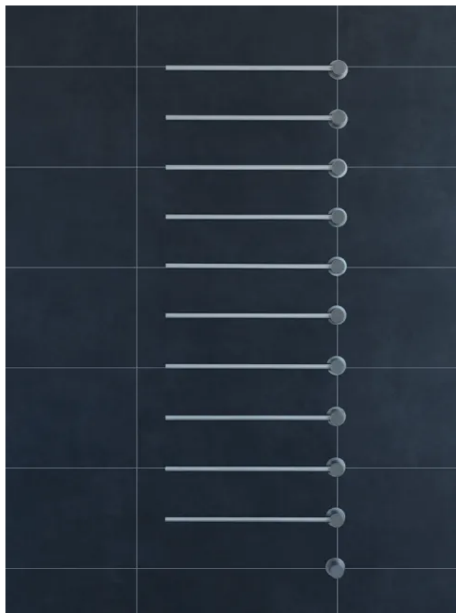
T39EL / 10

Aus der Serie Sanitärarmaturen und Accessoires von VOLA