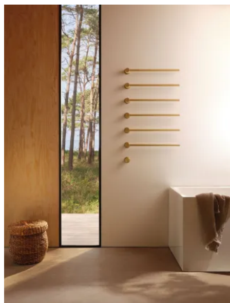
T39EL / 6