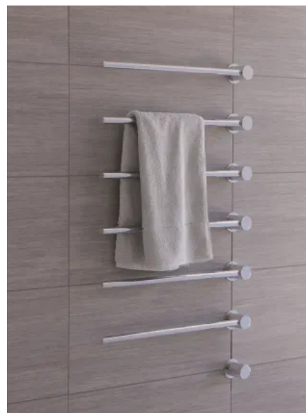
T39EL / 6