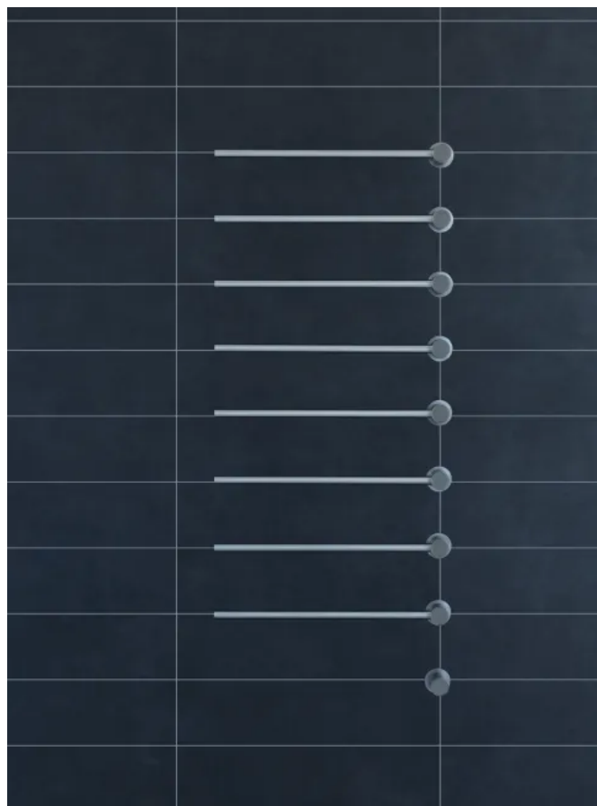
T39EL / 8