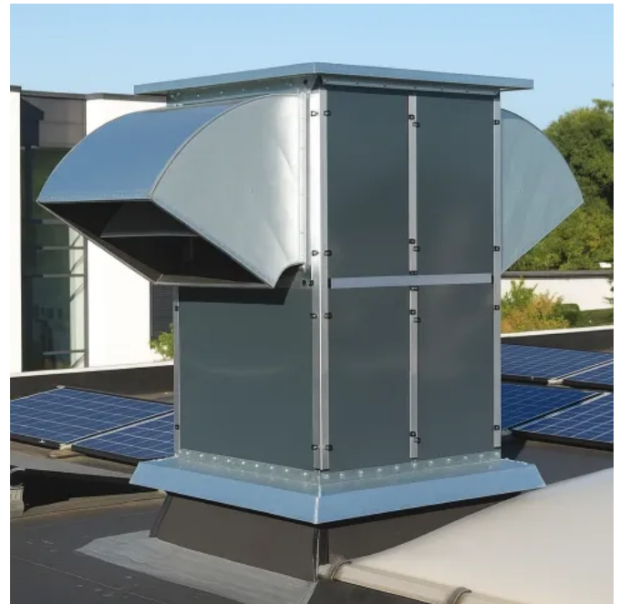
Kein Kanalsystem erforderlich, Be- und Entlüftungsggerät mit Wärmerückgewinnung