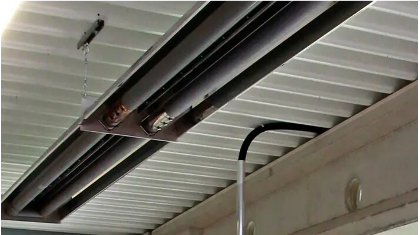
Energieeffiziente und wartungsarme Gas-Dunkelstrahler von VACURANT

Aus der Serie Hallenheizungssysteme und Hallenlüftung von VACURANT Heizsysteme