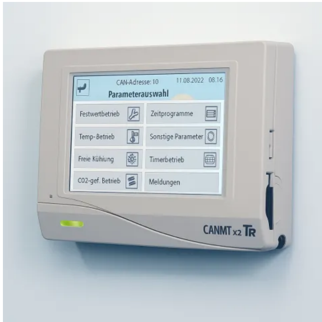
Integration in Gebäudeleittechnik durch serienmäßige Modbus-Schnittstelle

Aus der Serie Hallenheizungssysteme und Hallenlüftung von VACURANT Heizsysteme