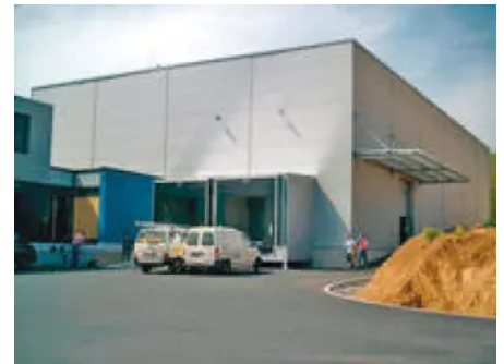
Warmluftheizungen mit Flüssiggas