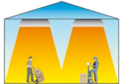
Dunkelstrahler erzeugen eine breite Wärmestrahlung.