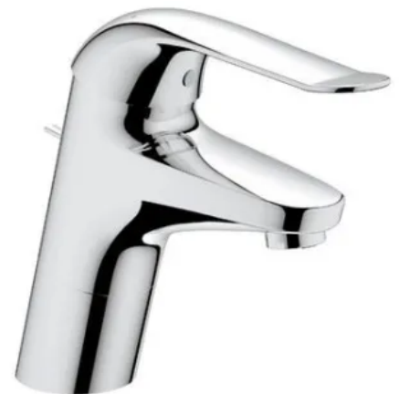
GROHE Euroeco Special Einhandmischer