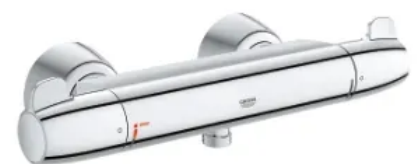
Grohtherm Special Thermostat-Brausebatterie