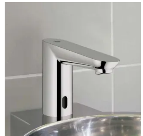
GROHE Euroeco CE