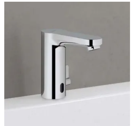
GROHE Eurosmart CE