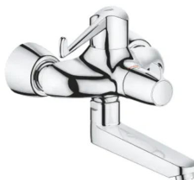
Grohtherm Special Thermostat-Waschtischbatterie für Armhebelbetätigung