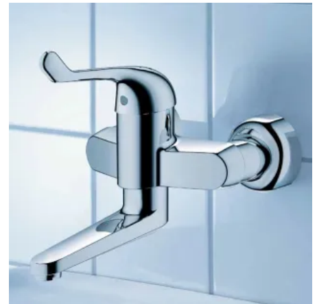
GROHE Euroeco Special Sicherheitsmischbatterie

Produktübersicht: Euroeco Special Sicherheitsmischbatterien