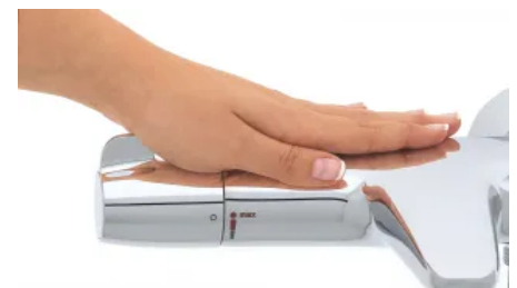
Der GROHE CoolTouch Thermostatkörper schützt sicher vor Verbrennungen.

Ob in Einrichtungen mit besonderen Anforderungen wie z.B. Krankenhäusern, Senioren- und Pflegeheimen oder unter der privaten Dusche: plötzlich auftretende Druckschwankungen können in einem Trinkwasser-Leitungssystem im schlimmsten Fall Verbrühungen verursachen. Die Thermostataratur Grohtherm Special sorgt dank GROHE TurboStat® Technologie immer für eine gleichbleibende Wassertemperatur und erfüllt höchste Anforderungen für eine sichere Benutzung.