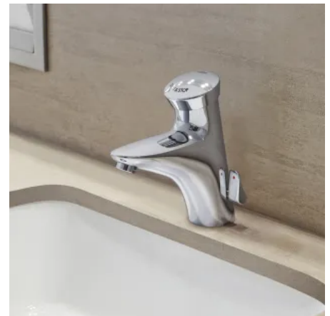
GROHE Eurodisc SE