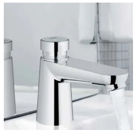
GROHE Euroeco CT