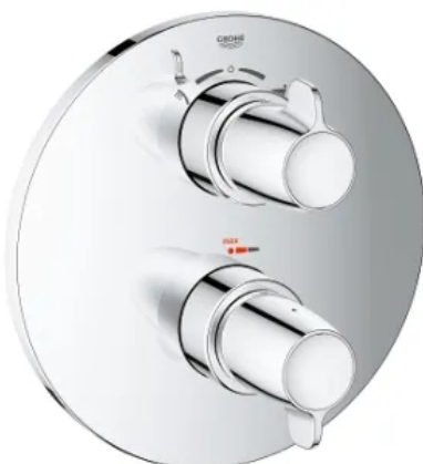
Grohtherm Special Badewannenbatterie in UP-Version

Das Sortiment der Grohtherm Special Thermostate umfasst Auf- oder Unterputz-Varianten für Brause, Badewanne oder als Zentralthermostat. Die glatten Oberflächen in GROHE StarLight® Chrom sind schmutz- und fleckenabweisend und lassen sich einfach reinigen.