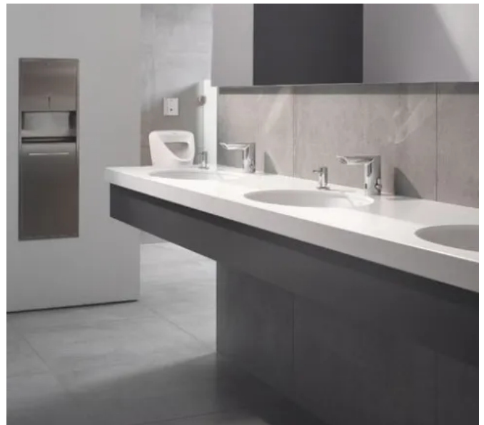
Waschtischarmatur mit Infrarotauslösung Bau Cosmopolitan E für den gewerblichen Wasorraum

Im gewerblichen Bereich sind diese Aspekte bei der Auswahl wichtig: