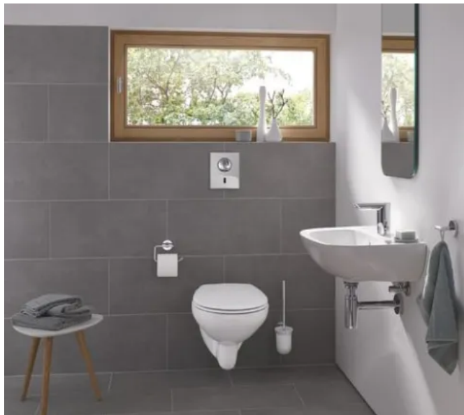
Waschtischarmatur mit Infrarotauslösung Bau Cosmopolitan E für das private Bad

Im privaten Bereich bieten berührungslos gesteuerte Armatur von GROHE viele Vorteile: