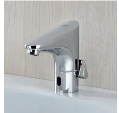
GROHE Europlus E