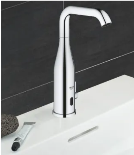
GROHE Essence E

Aus der Serie GROHE Spezialarmaturen von GROHE