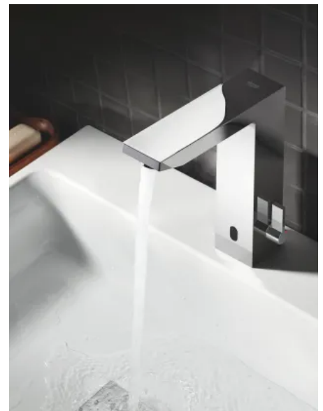
GROHE Eurocube E