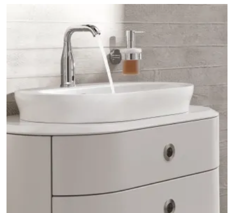
GROHE Essence E mit Infrarot-Elektronik für Waschtisch in neuem abgerundeten Design

Verschiedene Modelle für die Wand- oder Waschtischmontage erfüllen alle Projektanforderungen. Essence E hat eine reduzierte Durchflussmenge und eine automatische Endabschaltung.