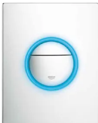
Nova Cosmopolitan Light