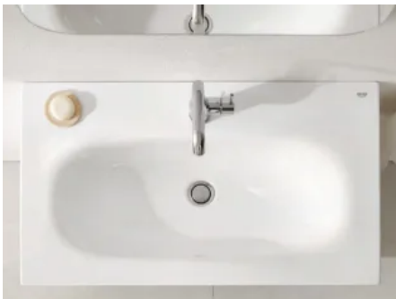
Möbelwaschtisch Essence Keramik