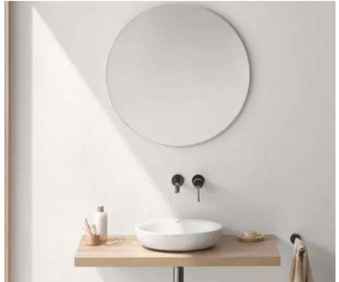
Waschplatz mit Essence Aufsatzschale

Übersicht der Keramiklinie Essence Keramik