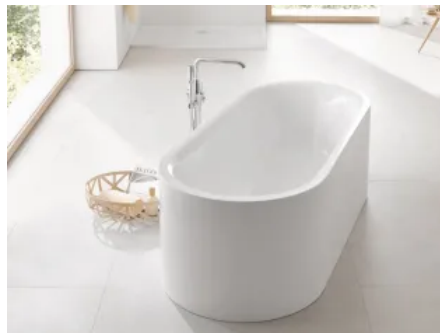
Freistehende Essence Badewanne