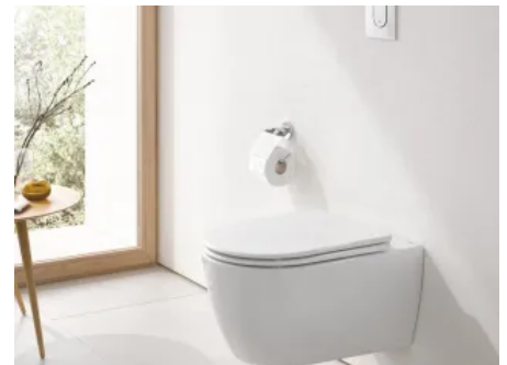
Wand-Tiefspül-WC Essence Keramik