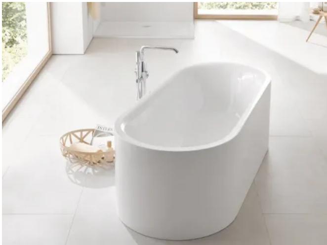
GROHE Essence freistehende Badewanne

Aus der Serie GROHE Duschwannen und Badewannen von GROHE