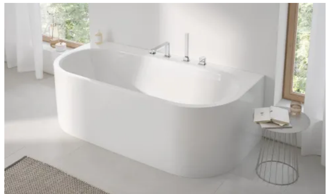
GROHE Essence Rechteck-Badewanne, Vorwandversion