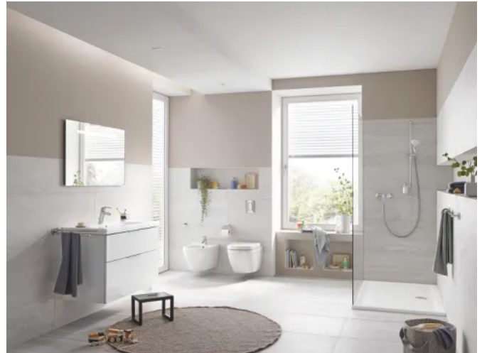
GROHE Duschwanne kombiniert mit Euro Keramik-Objekten

Weitere Informationen zu GROHE Duschwannen