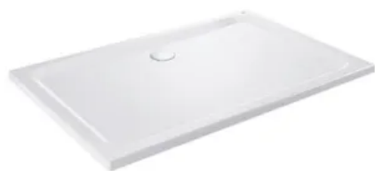
GROHE Duschwanne in Rechteckform

GROHE schlägt verschiedene aufeinander abgestimmte Kombinationen von Keramik, Duschwanne, Badewanne und Armaturen und Accessoires vor, die dem Architekten und Planer bei der Produktauswahl helfen.