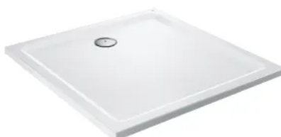
GROHE Duschwanne in Quadratform