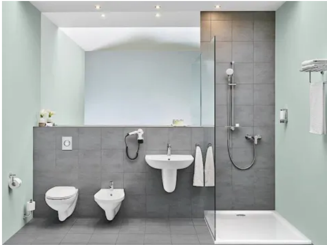
GROHE Duschwanne kombiniert mit Bau Keramik-Objekten und Armaturen BauEdge

Aus der Serie GROHE Duschwannen und Badewannen von GROHE