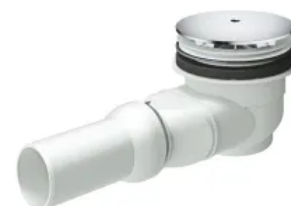
Ablaufgarnitur mit verchromter Abdeckhaube