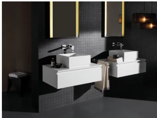
Einzelwaschtisch Cube Keramik