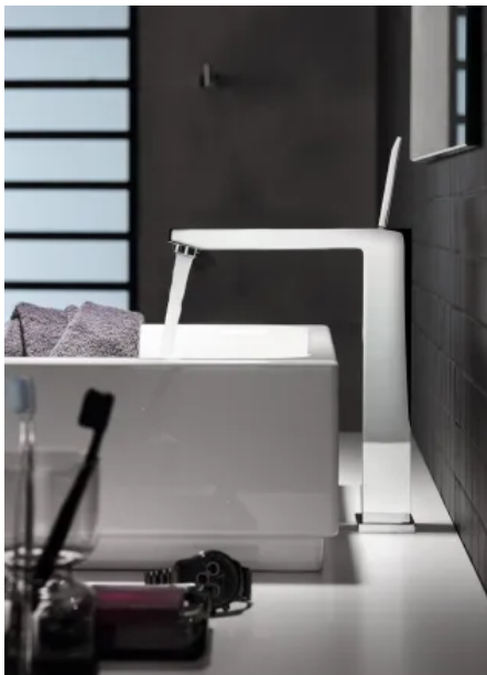
Cube Keramik Handwaschbecken