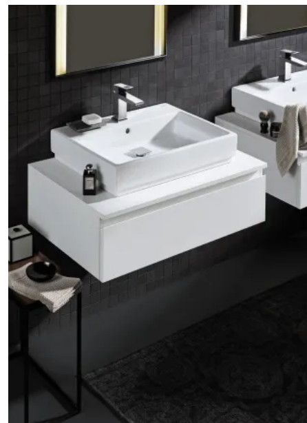
Cube Keramik Aufsatzwaschtisch