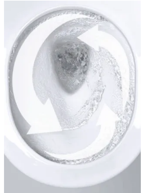
TRIPLE VORTEX Spültechnologie

Dank GROHE PureGuard sind Euro Keramik und Cube Keramik mit einer widerstandsfähigen und dauerhaft glänzenden Oberfläche ausgestattet. Langlebige Ionen mit einer antibakteriellen Wirkung verhindern das Bakterienwachstum und sorgen dafür, dass die Keramikoberflächen sauber und keimfrei bleiben. Die glatte Oberfläche von PureGuard stoppt zudem die Ablagerung von Kalk und Schmutz und lässt sich mühelos reinigen.