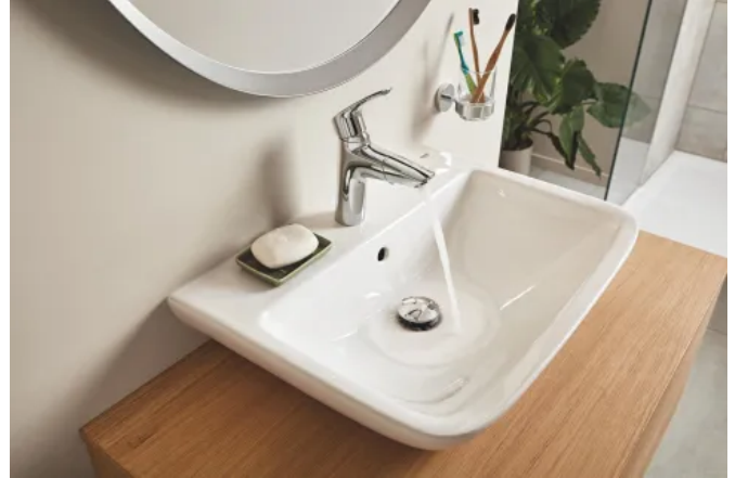
GROHE BauEdge Keramik Waschtisch

Die Waschtische mit weichen Linien aus langlebiger Keramik verleihen dem Bad eine moderne Optik. In drei Größen verfügbar, 600 x 450 mm, 550 x 400 mm und als Handwaschbecken in kompakten Maßen 450 x 350 mm.