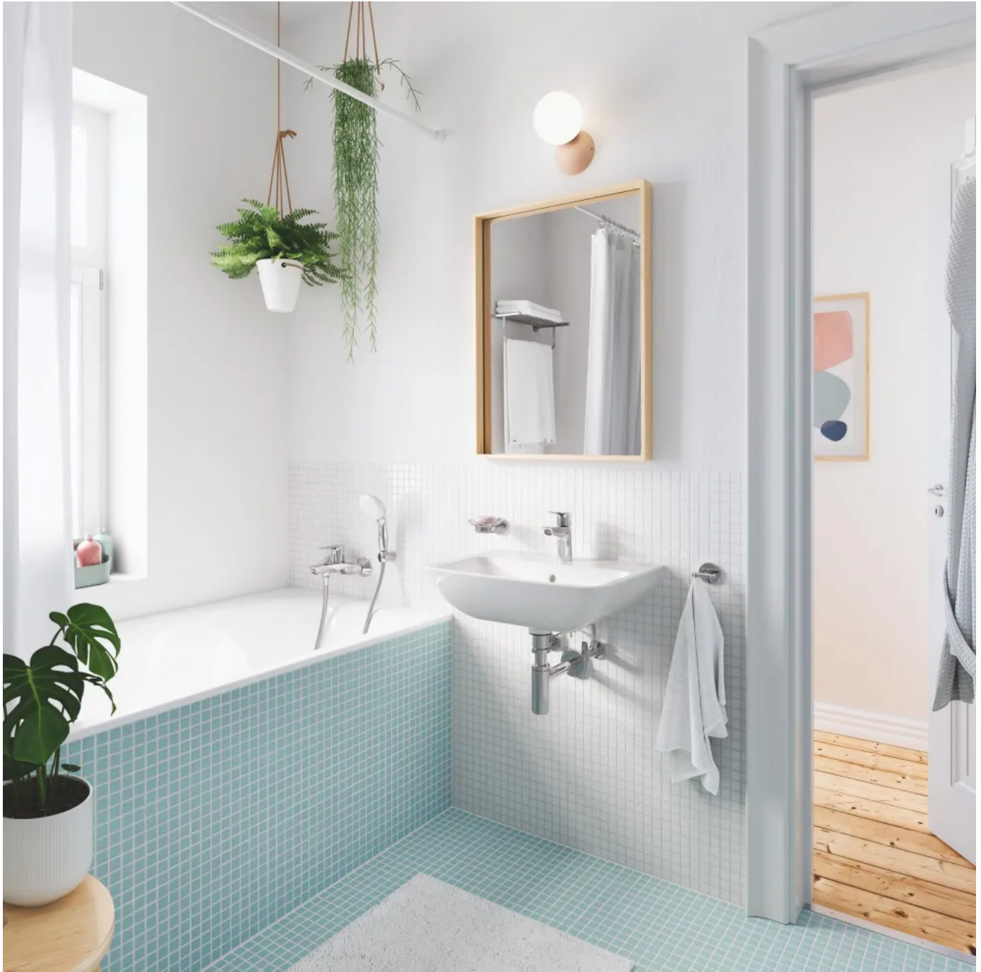
Grohe BauEdge Keramik