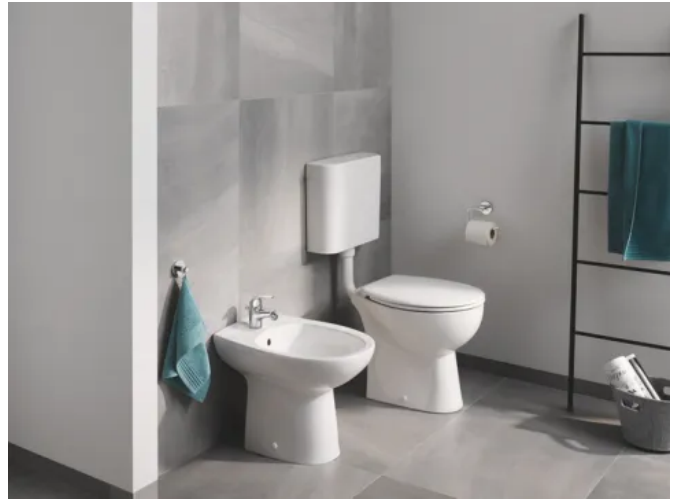
Grohe Bau Keramik Stand-WC und -Bidet

Dank ihrer schlanken Form ist Bau Keramik ideal für den Einsatz im Wohn- und Objektbau.