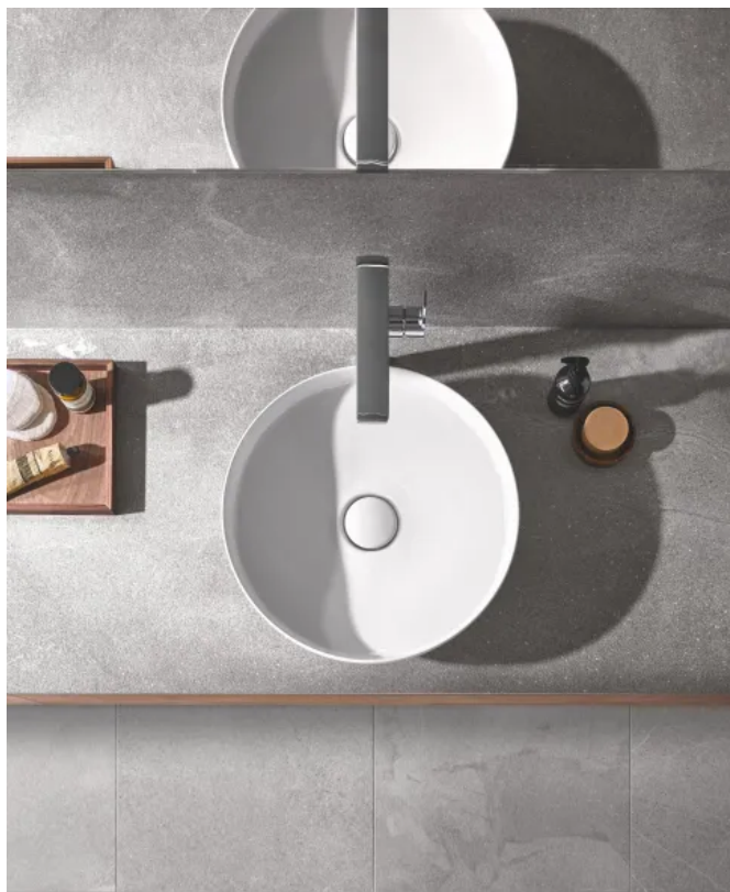
GROHE Airio. Dieser runde Waschtisch ist die perfekte Ergänzung zu den Atrio Kollektionen.