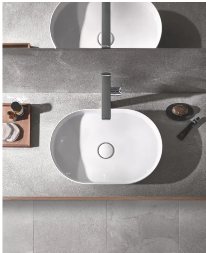
GROHE Airio. Durch die harmonischen Linien passt dieser ovale Waschtisch besonders gut zu den Armaturenkollektionen Allure und Atrio.