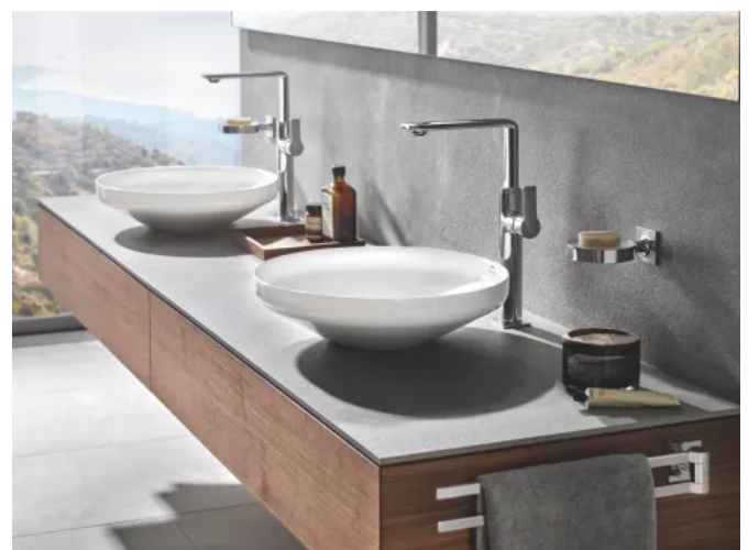
Aufsatz-Waschtische GROHE Airio

Die Waschtische sind mit der GROHE PureGuard Hygiene-Oberflächentechnologie ausgestattet. Diese sorgt dafür, dass sich weder Bakterien noch Kalkrückstände absetzen und eine mühelose Reinigung möglich ist. Das optische Gesamtbild wird durch eine nicht verschleißbare Keramik-Ablaufgarnitur im schlanken Design abgerundet. Im Lieferumfang enthalten ist ein Befestigungsset. GROHE Airio ist perfekt auf die GROHE Allure und Atrio Waschtischarmaturen der Größe XL sowie auf Armaturen für die Wandmontage abgestimmt.