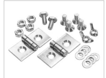
Gelenk- und Befestigungs-Set

Produktübersicht und weitere Informationen: Kaminhauben und -zubehör