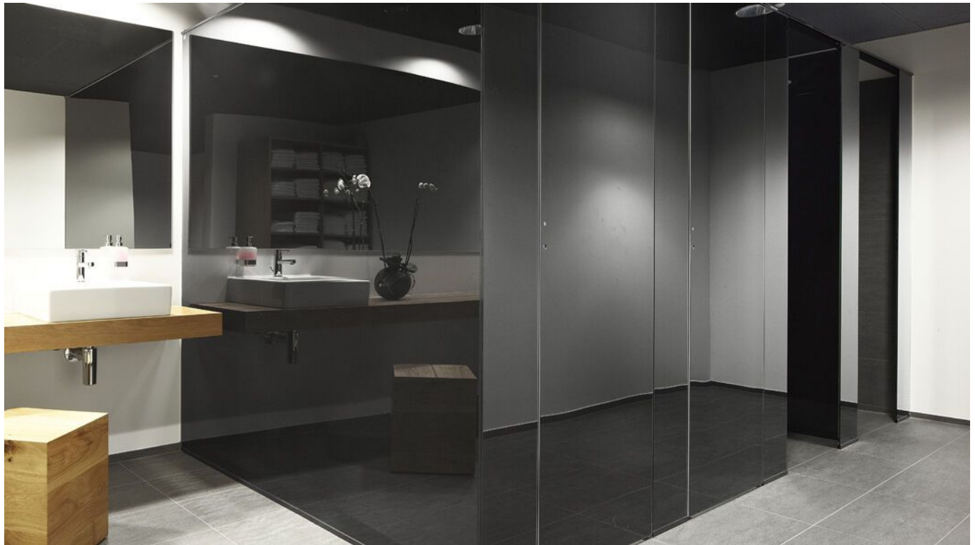
Glas-Trennwand-Module für den Sanitärbereich und Umkleidekabinen.

Aus der Serie Glas-Trennwände, Glas-Türen und Schiebetürsysteme von Glas Marte