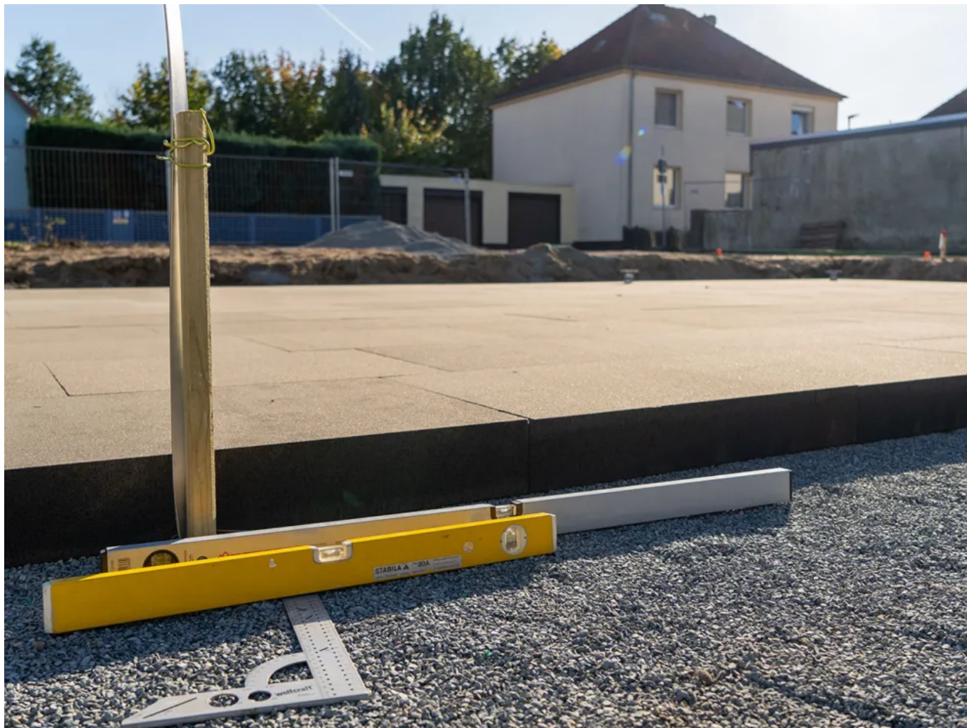
Die Verlegung der GLAPOR Schaumglasplatten erfolgt durch einfaches Auflegen im Splittbett im Versatz.

Aus der Serie GLAPOR Bodenplatte UBM1 von GLAPOR Werk Mitterteich