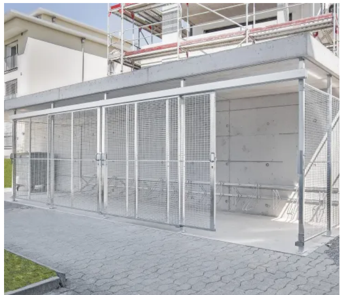
Gittereinhausung aus Gittertrennwänden MultiSafe