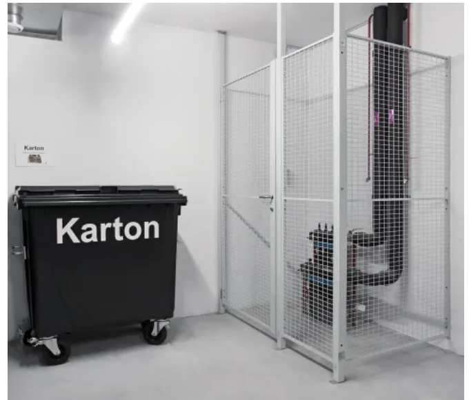
Technikabsicherung mit Gittertrennwand MultiSafe

Die Ausführung als Gitterboxen/Lochblech ist eine preisgünstige Lösung mit wählbaren Ausstattungsoptionen wie ein- oder zweiflügelige Türen, Vorhangschloss, Wechselschloss oder Riegelschloss, Wandmontage oder Bodenmontage.