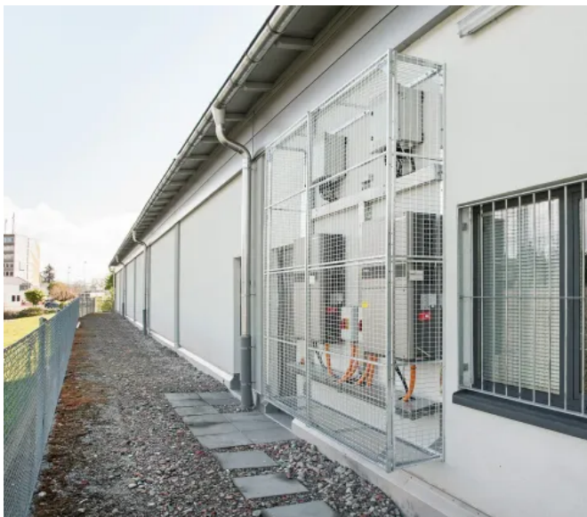
Vandalenschutz mit wandmontierter Gitterbox