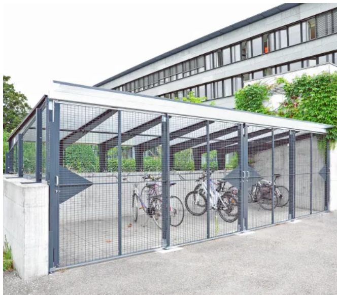
Gittereinhausung aus MultiSafe Gittertrennwänden mit Schiebetür