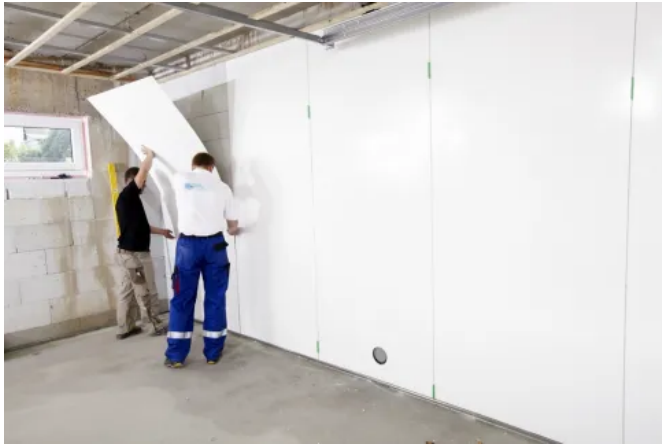
Ergonomisches und sauberes Arbeiten

Aus der Serie GFK-Wand- und Deckensysteme von ECP Gesellschaft