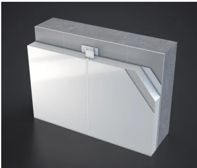
ECP-Sanierungselement (GFK glatt mit harter Fuge)

EasyClean-Pan® Sanierungselemente sind dünne, selbsttragende Sandwichelemente mit GFK-Deckschicht, die mittels H-Montageschiene mechanisch fixiert werden. Die helle Systemoberfläche (glatt oder strukturiert) ist korrosionsfrei und physiologisch unbedenklich. Da die EasyClean-Pan® Sanierungselemente leicht zu reinigen sind, werden sie in Räumen der Lebensmittelindustrie, in Kühlräumen sowie in Nassbereichen eingesetzt.