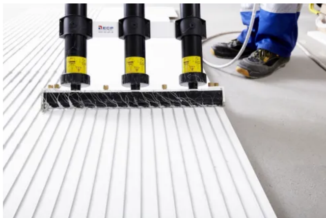
Maschineller Kleberauftrag (ca. 40 Sekunden pro m²)

EasyTape 4 ist ein innovatives Wandbekleidungssystem aus GFK-Tafeln, das für die direkte Verklebung auf tragfähige Untergründe wie Stahlblech, Fliesen oder Beton entwickelt wurde. Es umfasst alle notwendigen Komponenten wie GFK-Deckschichten, Kleberpistolen und GFK-Flächenkleber Typ1 sowie Verfugungsmaterial.